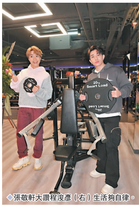
◆張敬軒大讚程浚彥(右)生活夠自律。

Tyson表示目標是在半年內回本，如果今年成績好，希望在港島開多間分店。軒仔聞言即自薦做分店代言人，笑指自己還有健身代言。說到他的代言費很貴？軒仔笑言他們是不講錢的，又大讚很喜歡這裏是單對單形式：「我覺得揀選健身室信任好緊要，好怕有Sales嚟身邊Sale你買，買都唔緊要，但要有效，同理如果係公開啲，總係覺得身後有人望住你。」問到Tyson下個目標會否想同軒仔拍戲？從未拍過戲的他直言對拍戲很害怕，軒仔即笑指拍戲跟拍MV差不多，只是時間長一點而已。