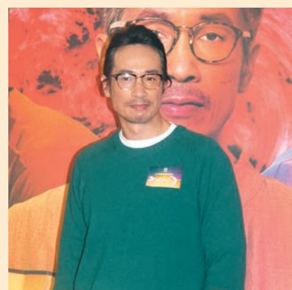
◆陳豪自言拍劇有留意鏡頭運用。