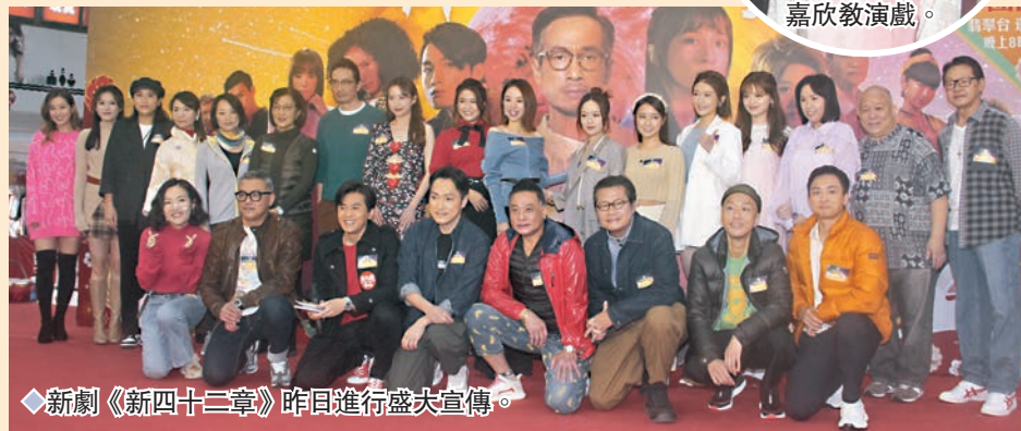
◆新劇《新四十二章》昨日進行盛大宣傳。