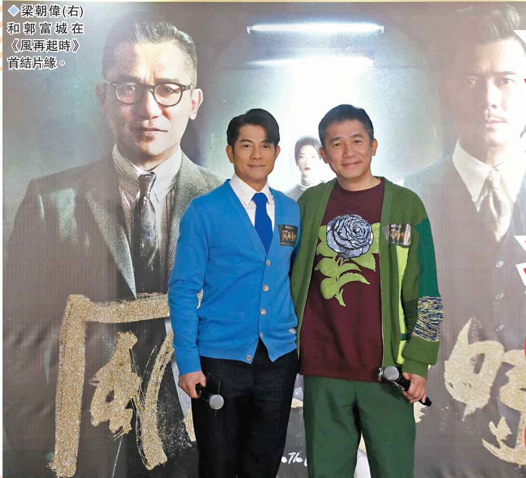
◆梁朝偉(右)和郭富城在《風再起時》首結片緣。