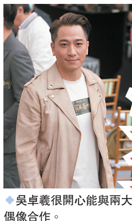
◆吳卓羲很开心能與兩大偶像合作。