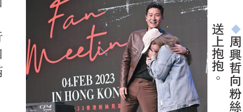
◆周興哲向粉絲送上抱抱。

出道8年的Eric在見面會中也剖白真我一面,說:「國小時常被人說我是個小丑,是我很喜歡搞笑,也有很多人認為我很sad,其實not,我是個很陽光、很開心的人,只是我很喜歡浪漫的旋律,套入一些歌詞,就會變成很touching的歌曲。」他也提到:「歌曲拿不拿獎項不重要,最重要是能感動你們,所以將來會拿出更感動的作品給大家。」最後粉絲們送上精美蛋糕,預祝Eric演唱會成功,Eric也與粉絲一同大合照,見面會也圓滿結束。