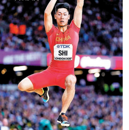
◆石雨豪表現備受期待。

另外24歲的石雨豪，是2018年亞洲室內田徑錦標賽男子跳遠項目的冠軍。2018年鑽石聯賽上海站，他在創造8米43個人最好成績的同時遭遇重傷，傷癒後石雨豪更多參加的是短跑項目的比賽。此次亞洲室內田徑錦標賽石雨豪將與小將黃邑一起參加男子60米項目的爭奪。 ◆新華社