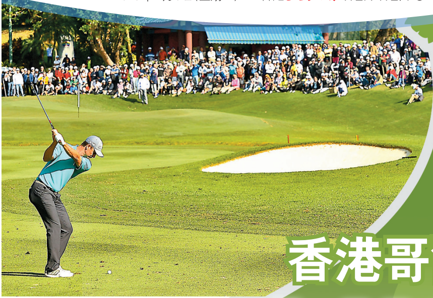
◆三大世界級高球賽於粉嶺球場上演，勢必進一步提升香港作為國際體育盛事之都的地位。 香港哥爾夫球會圖片

▶「沙特阿美石油團體系列賽」是全球最大型女子高球團體賽事，首次於香港舉辦分站賽事。 香港哥爾夫球會圖片