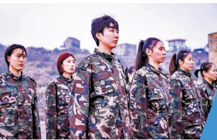
◆中國女排開展軍訓活動。