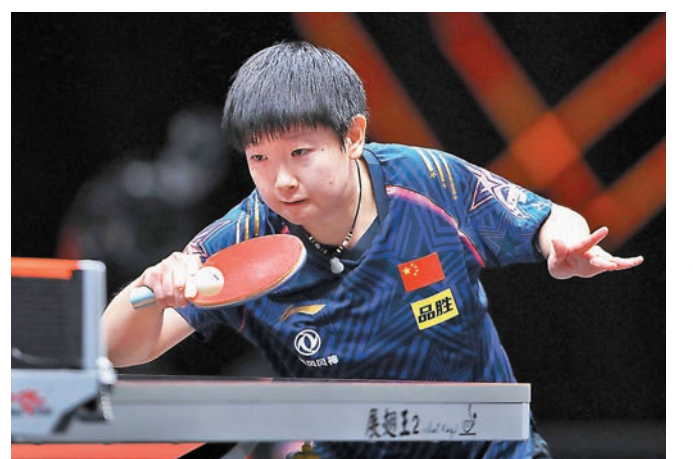
▶孫穎莎在三個項目中排名第1位。

至於港隊戰將排名，黃鎮廷在男單位列第29位；女單杜凱琹排名第9位，李皓晴排名第60位；男雙黃鎮廷/何鈞傑排名第16位；女雙杜凱琹/朱成竹排名第12位，杜凱琹/李皓晴組合則排名第16位；至於混雙方面，黃鎮廷/杜凱琹排名第5位。