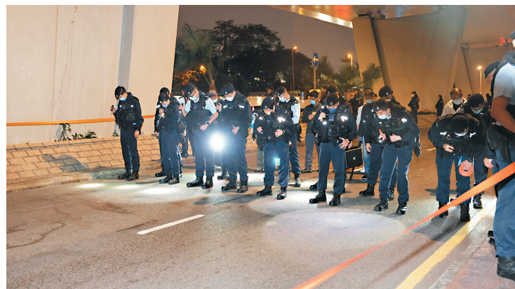
▲法院對出通州街大批警員搜證。