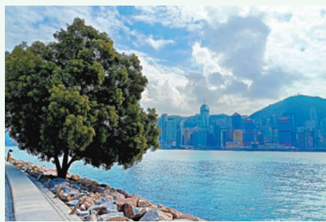
作者坐在西九文化區海旁，隔海遙望萬家燈火。

北京城市比例大於香港，在路上踟躕的感覺是不一樣的。比較起來，香港是馬路窄、路網密，而北京是馬路寬、路網疏。記得十多年前我剛到北京，智能手機仍未普及，出