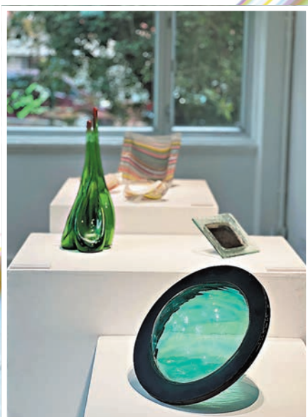
不同形態的玻璃容器。

黃國忠閉關了一個月去做這次的展覽，主題定為「焦點」，他說明道：「焦點是攝影機去找一個好的重點，而我作為多元藝術創作者，也是想要幫自己找到一個焦點。」後來，他發現自己的焦點很多，因此，到了最後，這種多可能性反而成為了黃國忠特殊的「焦點」。