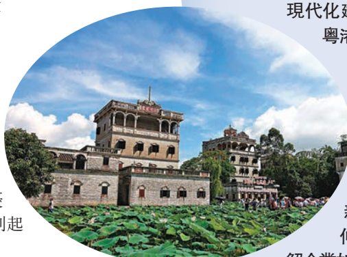
◆開平碉樓 資料圖片