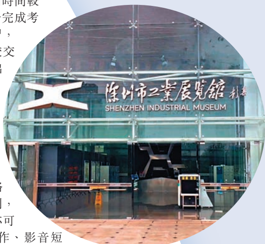
◆深圳市工業展覽館