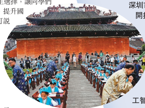
◆德慶學宮「開筆禮」 資料圖片