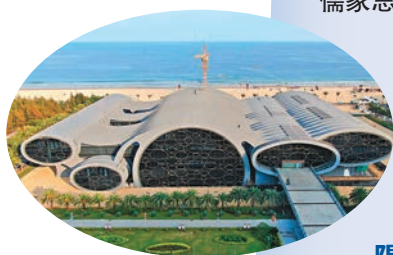
◆廣東海上絲綢之路博物館 資料圖片