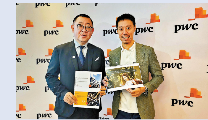
▲羅兵咸永道預料，恢復全面通關後，本地旅遊業開始緩慢復甦，今年零售業總銷貨價值增長13%。