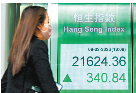
◆港股昨先跌後反彈，成交1,178億元。

AI概念股卻普遍偏軟，主要因內地官媒發聲，呼籲投資者切勿盲目跟風炒作AI概念股，百度(9888)初段最多曾跌8.5%，午後才見喘定，全日