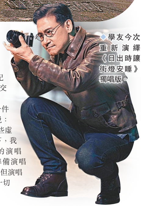
◆學友今次重新演繹《日出時讓街燈安睡》獨唱版。

學友亦希望藉今次機會澄清一件事,並透露一個大好消息,他說:「可能大家在網上都有看過一些虛假的演唱會信息,我想澄清一下,我並沒有一個叫什麼××之年的演唱會。」學友表示:「我是在準備演唱會,最有可能在未來半年發生,但演唱會名字就先保留不公布,希望一切可以順利進行。」