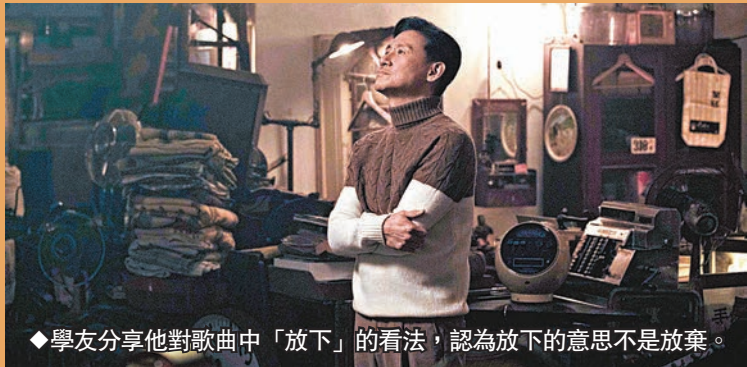
◆學友分享他對歌曲中「放下」的看法，認為放下的意思不是放棄。