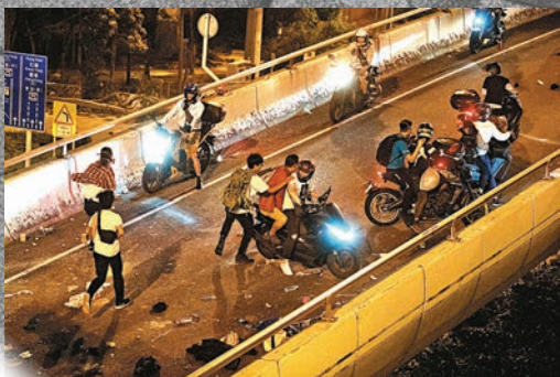
◆有「家長車」接載暴徒離開暴動現場。資料圖片