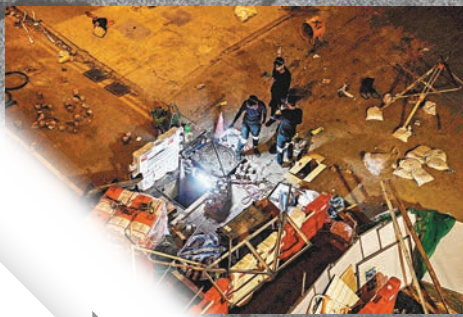
◆暴徒嘗試爬污水渠逃避警方追捕。資料圖片