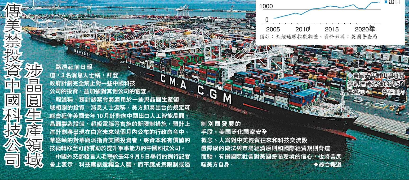
◆美國去年對中國貿易總額達破紀錄的約5.4萬億元。 資料圖片