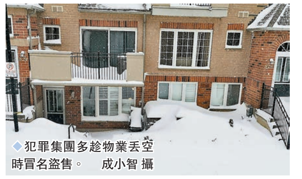
◆犯罪集團多趁物業丟空時冒名盜售。