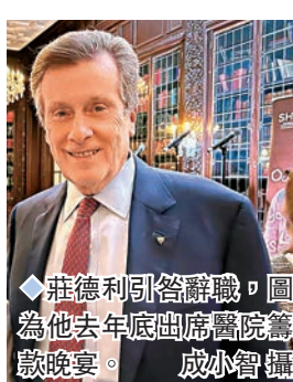
◆莊德利引咎辭職，圖為他去年底出席醫院籌款晚宴。

68歲的莊德利在聲明中指出，他是在疫期間因與結婚超過40年的妻子聚少離多，與一名31歲的下屬建立一段密切關係。他強調自己在疫期間一直履行職責，並就自己不當行為向妻子、市民、同僚，以及一切因其行為而受傷害的人道歉。