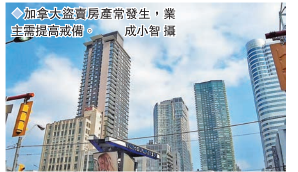
◆加拿大盜賣房產常發生，業主需提高戒備。

除了KIAG正在調查的4項索賠外，另有3間在加拿大提供產權投保的保險公司亦收到欺詐索賠。隨著涉及假冒業主轉讓產權和抵押貸款的欺詐索賠激增，保險公司擔心提供產權保險的風險愈來愈高，甚至需要考慮能否持續下去。在大部分情況下，真正的房產業主和買家獲得賠償。目前，加拿大有4間保險公司經營產權保險業務，業內估計整個行業在過去兩年半，已經就欺詐索賠損失最少2億加元(約11.68億港元)。