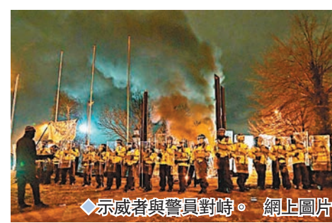
◆示威者與警員對峙。