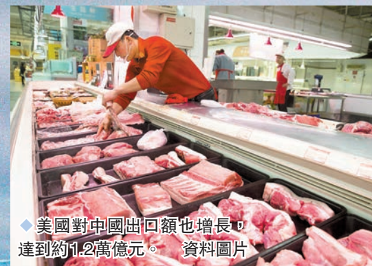
◆美國對中國出口額也增長，達到約1.2萬億元。 資料圖片