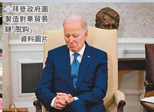
◆拜登政府圖製造對華貿易鏈「脫鉤」。