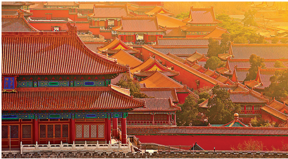
北京故宮建於永樂十八年(1420年)，原本叫紫禁城，1925年成立故宮博物院。

故宮北院區位於北京西北郊，距離原本的故宮約1小時車程。建成之後，每年展覽的文物就可以增加到兩三萬件，屆時觀眾可大飽眼福。