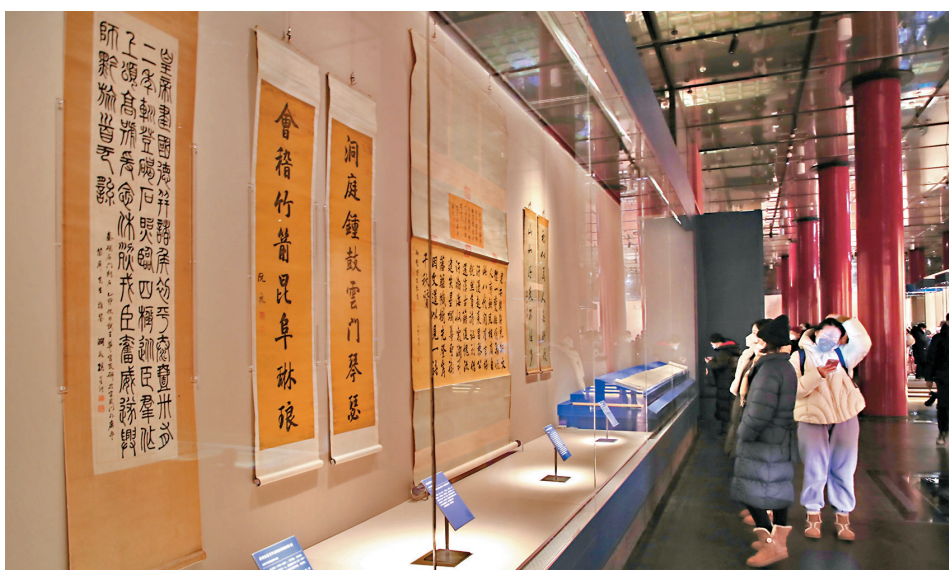
2023年1月22日，遊客在故宮博物院參觀《國子文脈》大展。

簡介：資深文化工作者，從事新聞及教育工作多年，曾主理高中通識科網站及參與教科書出版工作。