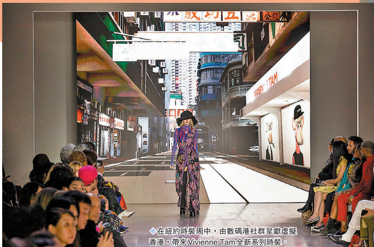
◆在紐約時裝周中，由數碼港社群呈獻虛擬香港，帶來Vivienne Tam全新系列時裝。