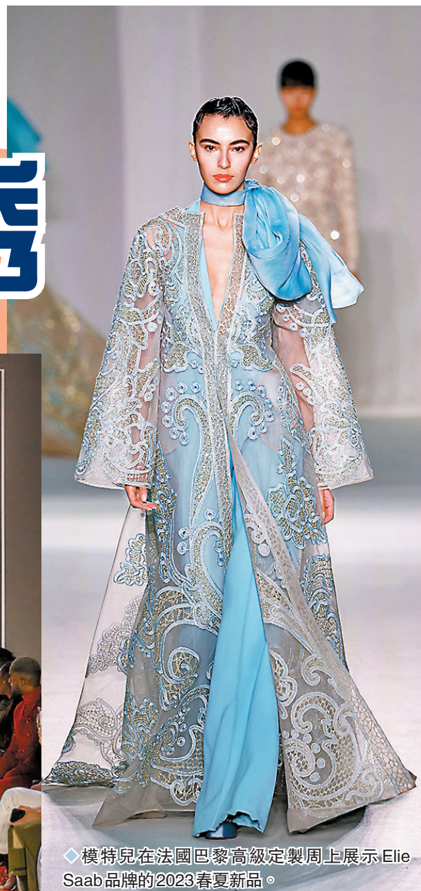
◆模特兒在法國巴黎高級定製周上展示Elie Saab品牌的2023春夏新品。