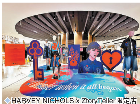
◆HARVEY NICHOLS x ZtoryTeller 限定店

HARVEY NICHOLS 分別由即日起至2月20日於金鐘太古廣場分店，以及由2月22日至3月7日於中環置地廣場分店開設 Pop-up 限定店，獨家推出一系列玩味時髦的衣飾，包括恤衫、百摺長裙、連身裙、絲巾、襪子、頸鏈及耳飾等，運用大膽鮮明的顏色及抽象有趣的印花，為一眾崇尚藝術的穿著者打造藝廊衣櫥，瞬間提升造型感，同時展現藝術感染力。 ◆採、攝：雨文