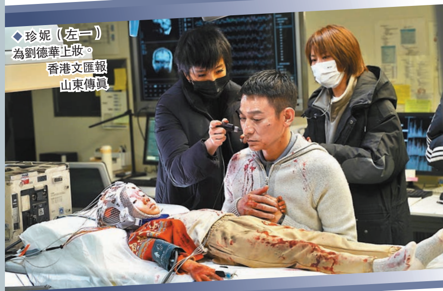
◆ 珍妮(左一)為劉德華正妝。