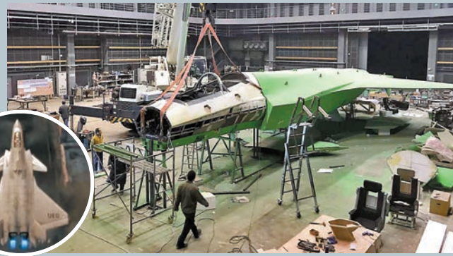
「殲20」香港大師鍾劍偉團隊為《流浪地球2》製作的劇照。「殲20」戰鬥機道具。