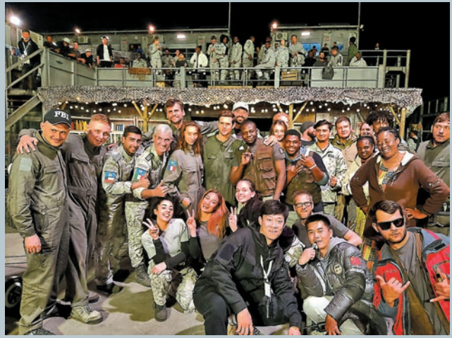
參與《流浪地球2》的外籍群演。