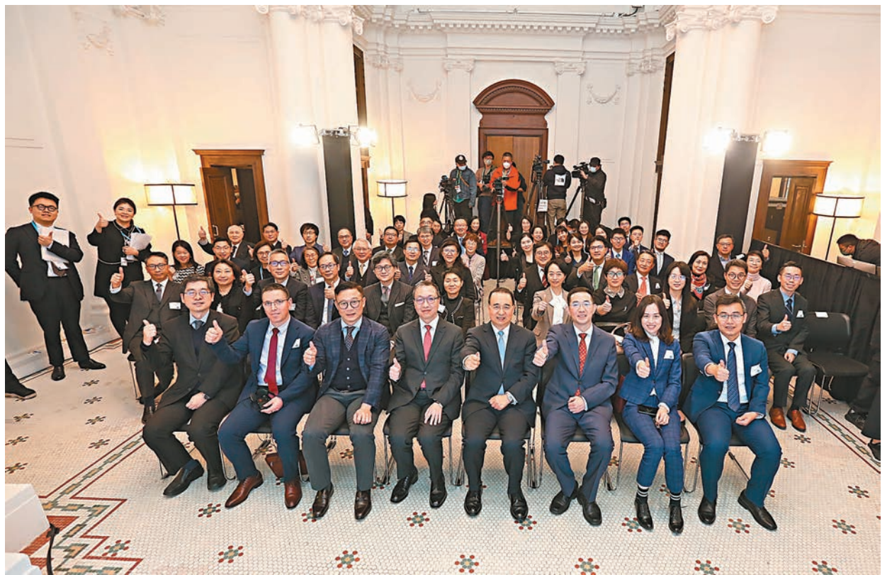
◆國際調解院籌備辦公室的成立儀式昨日在香港舉行。