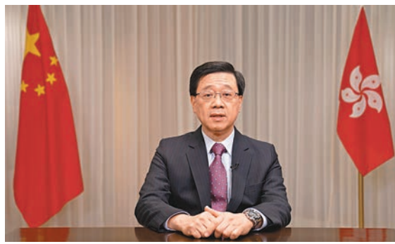
◆李家超在成立儀式通過視像致辭。

律政司司長感謝中央政府、外交部及《聯合聲明》簽署國的堅定支持和信任，標誌着對香港作為亞太區國際法律和爭議解決服務中心投下信任一票。律政司期待並將支持國際調解院的正式成立，以推動及應用調解以解決各類國際爭議。