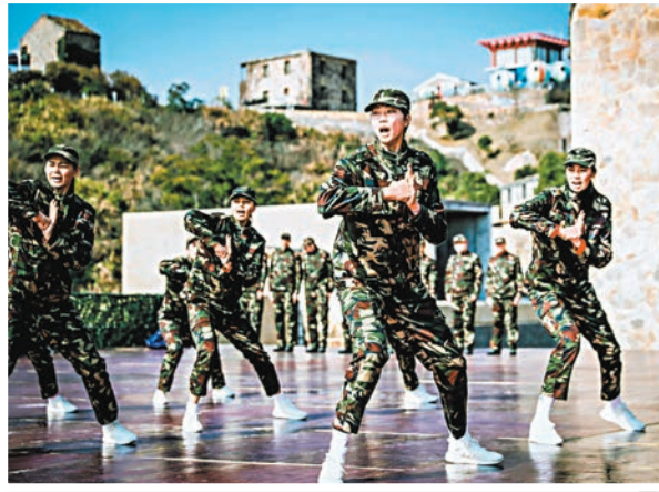
▲女排姑娘學習軍體拳，颯爽英姿。