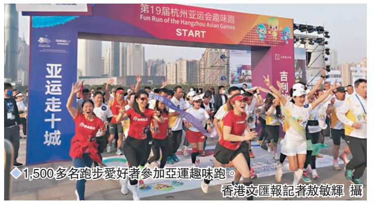
◆1,500多名跑步愛好者參加亞運趣味跑。