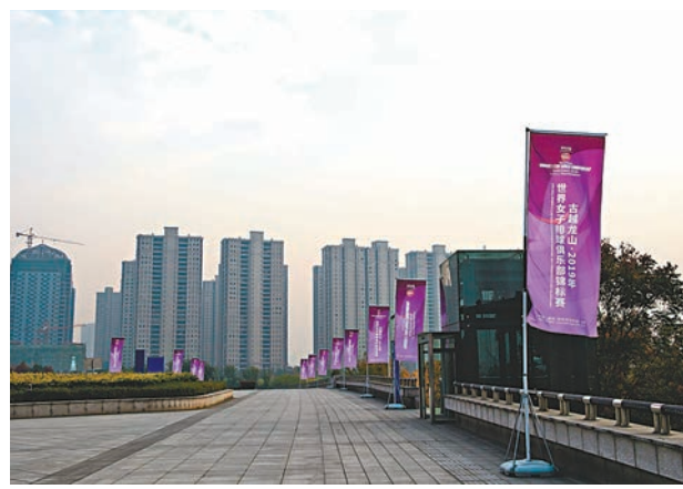
◀女排世俱盃曾於2019年在浙江舉行。