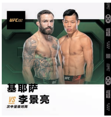
◆李景亮(右)將於香港時間4月9日對陣基耶薩。