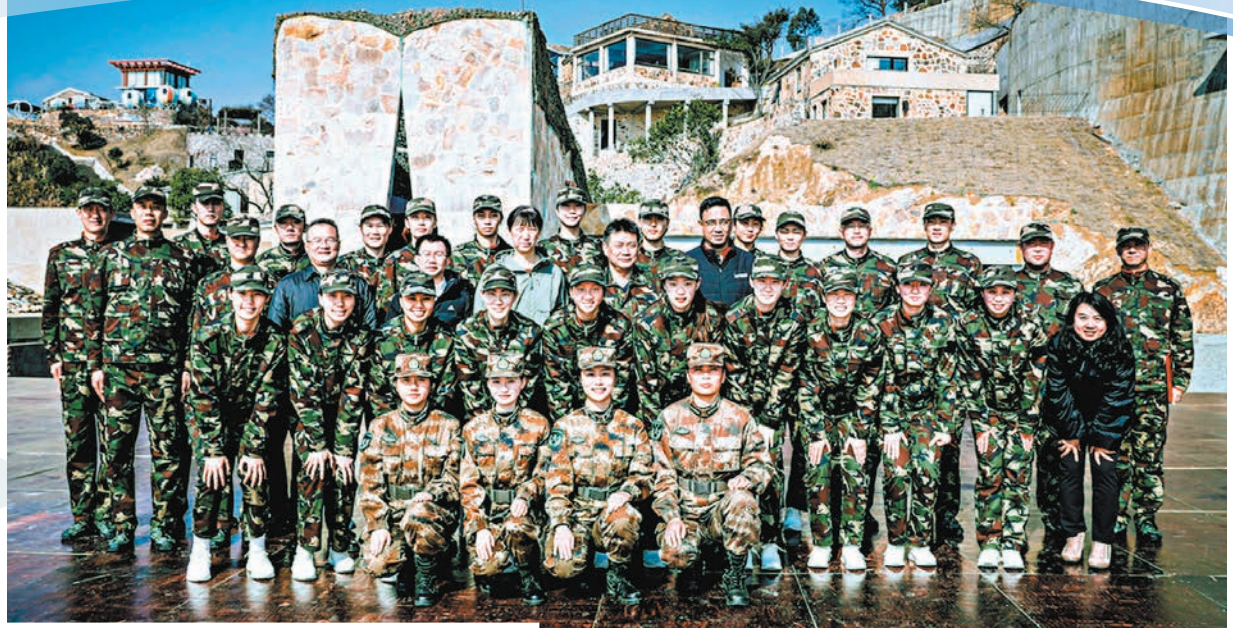
◆中國女排結束為期11天的軍訓。