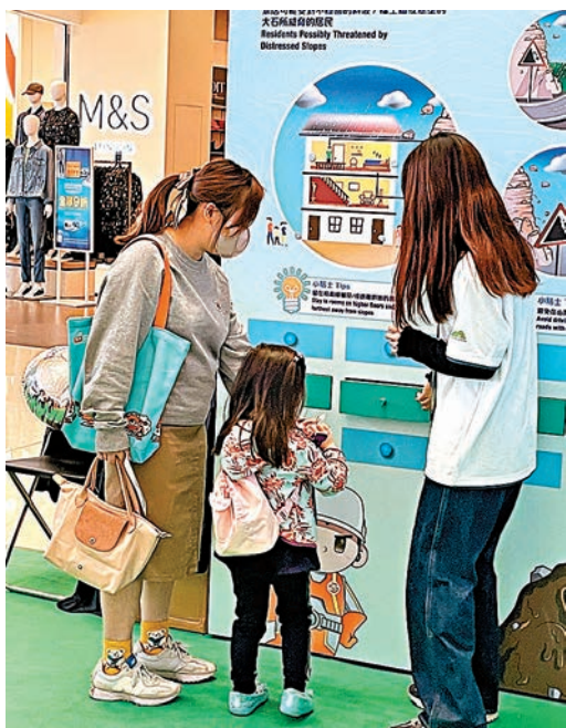
張太太表示，這次活動對女兒來說是寓學習於遊戲的好機會。

香港文匯報訊（記者 吳健怡）香港山多平地少，為了讓市民在雨季來臨前做好山坡維護準備，以及提高對山泥傾瀉災害及斜坡安全的意識，土木工程拓展署在大角咀奧海城二期舉辦老少皆宜的「親子斜坡安全嘉年華」，現場有不少展板，讓市民回顧1972年兩宗嚴重的山泥傾瀉災難，並向他們介紹現在的香港斜坡安全系統。