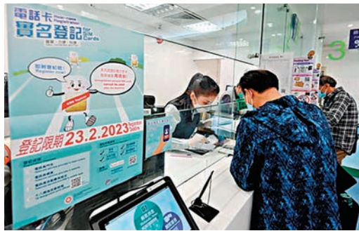
18間設有支援服務櫃位的郵政局，會於周三四延長服務時間至晚上7時。

對有的士協會希望政府豁免120元買司機卡規定，羅淑佩表示，政府正在研究，但目前有逾20萬名持有的士駕駛執照人士，其中僅4萬人屬活躍司機，如果只「簡單每人派一張」，並非最符合使用公帑的原則，而只向活躍司機免費派發亦非最佳做法。