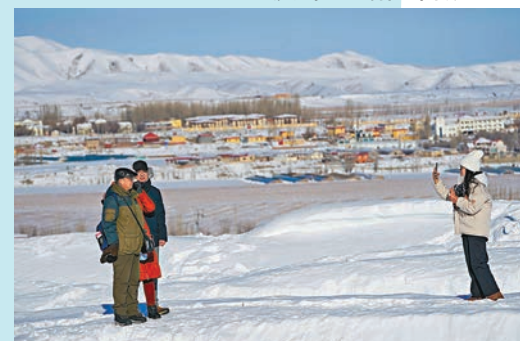
◆ 遊客在烏魯木齊市南山一處雪地上拍照留影。

入冬以來，新疆昭蘇縣各族農民開展豐富多彩的民間文化體育活動，豐富冬閒時節生活。在昭蘇縣薩爾闊布鄉一處雪原上，當地農民進行「姑娘追」活動，「姑娘追」是哈薩克族的傳統馬上體育運動。另外，新疆阿克蘇地區沙雅縣以南的塔克拉瑪干沙漠早前也迎來降雪，雪落如畫。同時，遊客在烏魯木齊市南山一處雪地上拍照留影。