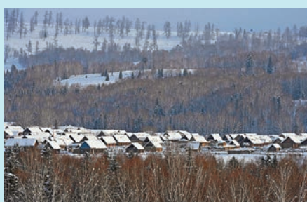
◆ 新疆阿勒泰地區禾木村雪景