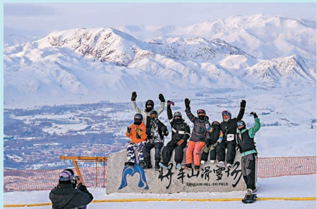
◆ 遊客在新疆阿勒泰將軍山滑雪場合影留念。

畫，禾木村的小朋友其力格爾更在小木屋前玩耍，而不少雪友也阿勒泰地區滑雪，如在阿勒泰市將軍山滑雪場，很多遊客來滑雪遊玩，禾木吉克普林滑雪場更成為雪友眼中的「網紅打卡地」。