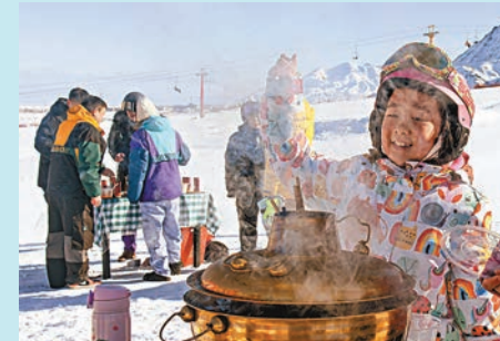
◆ 新疆白雲國際滑雪場，小朋友在雪場舉辦的冰雪火鍋節上等待品嚐美食。