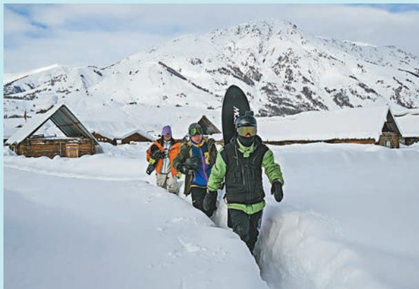
◆ 來自廣東的雪友在新疆阿勒泰地區禾木村遊玩。