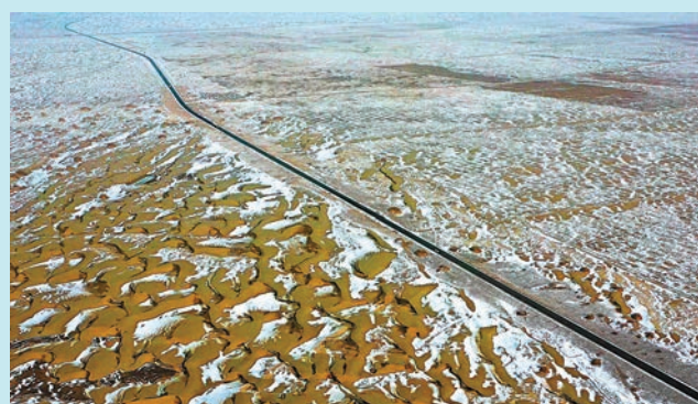
◆ 新疆阿克蘇地區沙雅縣以南的塔克拉瑪干沙漠