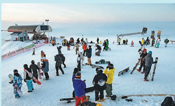
◆ 雪友在新疆阿勒泰市將軍山滑雪場滑雪遊玩。