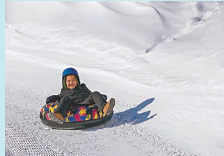
◆ 在絲綢之路國際滑雪場，小朋友在玩雪圈。

式歡度春節。在絲綢之路國際滑雪場歡樂谷上，滑雪愛好者在雪道上滑雪，小朋友在玩雪圈，滑雪場裏人聲鼎沸，特色民俗客流不斷。