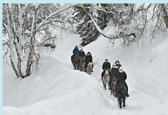
◆ 遊客在新疆阿勒泰地區騎馬賞雪。