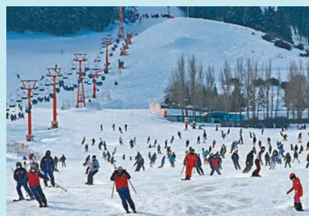
◆ 滑雪愛好者在新疆絲綢之路國際度假區滑雪場滑雪。