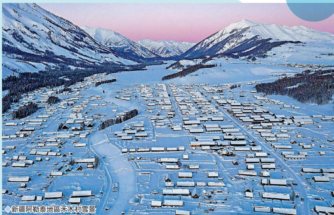
◆ 新疆阿勒泰地區禾木村雪景