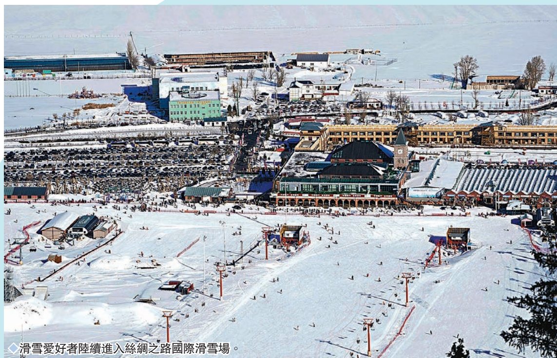
◆ 滑雪愛好者陸續進入絲綢之路國際滑雪場。