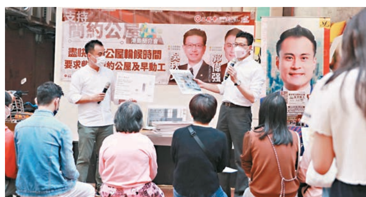
吳秋北聯同郭偉強昨日於北角街頭舉行簡報會，希望釋除市民對「簡約公屋」的誤解和疑慮。

香港文匯報訊(記者 文森)自「簡約公屋」推行以來，社會出現不同聲音，工聯會會長、立法會議員吳秋北昨日於北角街頭舉行簡報會，希望釋除市民對「簡約公屋」的誤解和疑慮，並指港島區亦是一個較多劏房的地區，尤其是北角，希望柴灣區的「簡約公屋」選址能盡快開展，政府亦應詳細向當區居民多作解說，做好柴灣區內的交通配套規劃。