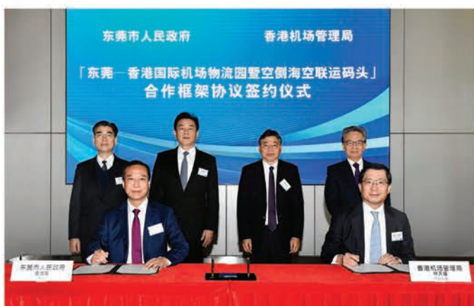
機管局日前與東莞市人民政府簽訂協議，推動創新的多式貨物聯運模式。

香港國際機場是大灣區國際貨運門戶，大灣區約75%的國際貨物經香港國際機場轉運至海外。為提升大灣區貨物轉運服務的時間效率及成本效益，機管局正透過在東莞建設香港國際機場物流園，以及在機場新增空側海空聯運貨運碼頭，發展全新的貨物聯運服務。