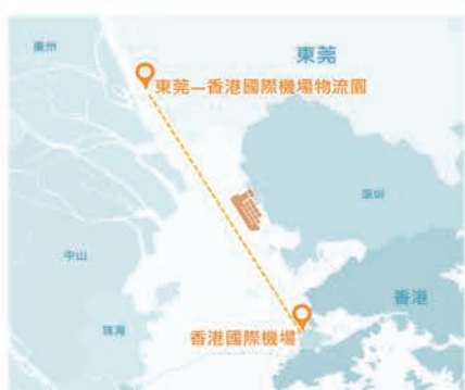
出口貨物經海路由東莞運送至香港國際機場禁區，直接轉口到世界各地。

項目將於2025年落成，先導計劃已順利展開。日後，先導計劃規模將擴大，讓更多航空貨運站營運商、航空公司及貨運代理加入提供上游服務，並將業務擴展至進口貨物。