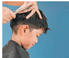
兒童剪髮。

現世代輪流轉，我兒在港的三周裏，為父親按摩、剪髮，剪出和尚頭似的；又常為父親剃鬚，父親感受兒子孝心，洗滌了他生活中負面的情緒……抽屜，藏着生活的精彩點滴，總是不響地映照着我們的歲月；也許期盼的生活稍縱即逝，但總有回憶的甜美讓我們喘息，慰解傷痛，帶來平和和安靜；關上抽屜，回憶的美好，仍似夕暉柔柔暖光照入心窩；而五味雜陳的種種回憶，可堪回味，讓人釋懷！