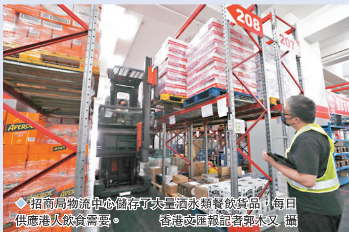
◆招商局物流中心儲存了大量酒水類餐飲貨品，每日供應港人飲食需要。