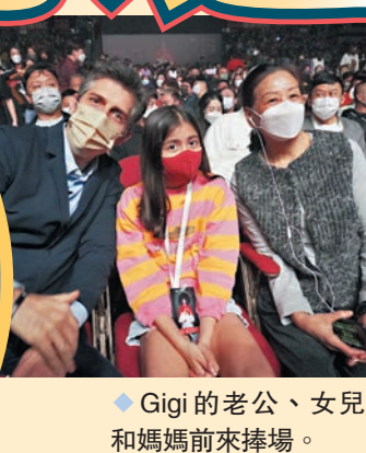
◆Gigi的老公、女兒和媽媽前來捧場。