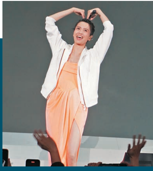
◆在演唱會上,Gigi感受到歌迷的愛情。

表演中段,Sammi以大露背盛裝到場,與Gigi合唱過後即又攬又咀,Sammi更表示選穿身上的歌衫具有雙重意義:「除為了要與Gigi配成『黑白雙煞』外,這件衫很像蝴蝶,因Gigi在我心目中就像蝴蝶段不斷蛻變,由少女時代的《百分百感覺》到現在成為一個女兒的媽媽,還把最好的自己交給歌迷。」Gigi亦大讚Sammi做任何事都好認真,即使做嘉賓也認真地穿上一對5吋高跟鞋,Sammi笑指難道穿着波鞋矮Gigi 3個頭。Gigi繼續很欣賞Sammi認真地對待任何事並力求進步,不管是拍戲或唱歌都付出200倍努力,入行前已經常聽Sammi的歌。Sammi笑問是否仍用尿布(BB)時已聽?Gigi即補充指Sammi是看着她入行的同輩歌手,逗得全場大笑。