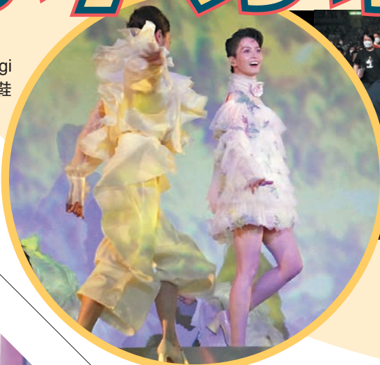
◆「高妹」Gigi仍穿上高跟鞋表演。