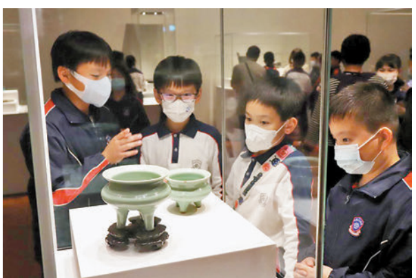
◆跨境學童首遊故宮館。

政青與香港故宮文化博物館合作推出為期半年的「青年穿越故宮之旅」活動，定期每月於香港故宮館舉辦閉館專場，邀請不同背景的教育機構學生前來免費參觀，亦將邀請國際學校的學生參與活動，以多元、有趣的方式探索中華文化。