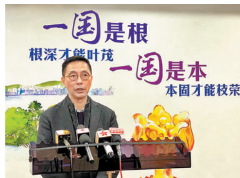
◆楊潤雄總結訪京行程。

在會面中，他重點介紹了文化體育及旅遊局未來工作重點和現時香港最新情況，特別提到如何重點落實國家「十四五」規劃綱要中把香港定為「中外文化藝術交流中心」的相關工作。他表示希望今後無論在政府層面、機構層面或是藝術表演層面，都能與內地多些交流和溝通，也商討了將來如何一同到其他地方多作聯合演出或交流。