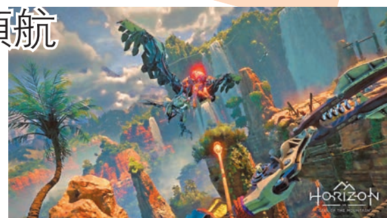
◆ PSVR2一推出即可玩到《地平線》外傳。

Xbox方面，主觀射擊RPG話題作《原子之心》今周一推出即登上Game Pass，連同世嘉的《人中之龍 維新！極》(Xbox、PS、Steam) 玩家將會有排忙；《維新！極》亦設有戰鬥體驗版讓機迷可提早練習打鬥技巧。分別來自Bandai Namco與Square Enix的《交響傳奇重製版》(Xbox、