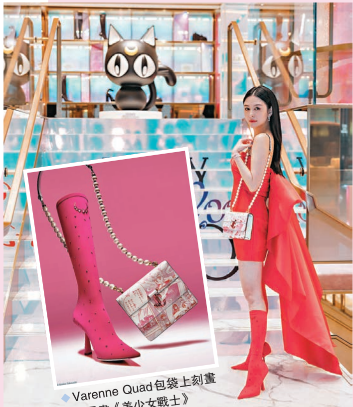
◆ Varenne Quad 包袋上刻畫經典漫畫《美少女戰士》