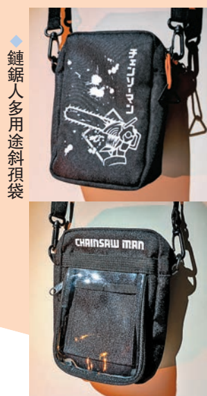
◆ 鏈鋸人多用塗斜預袋