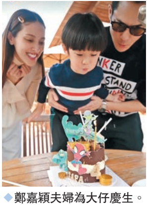
◆鄭嘉穎夫婦為大仔慶生。