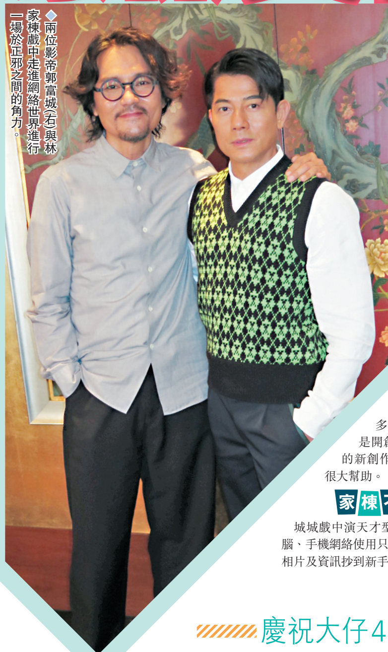
◆兩位影帝郭富城(右)與林家棟(左)走進網絡世界進行一場於正邪之間的角力。