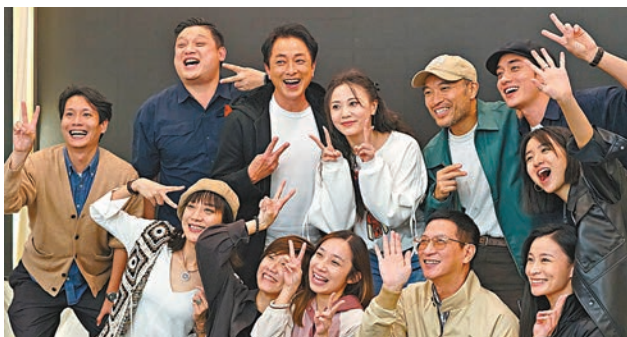
◆煞科宴現場充滿歡樂氣氛。