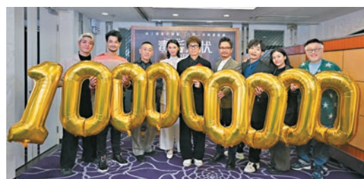
◆《毒舌大狀》演員賀票房破億。

香港文匯報訊(記者阿祖)《毒舌大狀》自今年1月21日開畫至今，上映32日屢破票房紀錄，並於昨天下午6時，更為香港電影史創下歷史性一刻，香港累積票房達$100,017,474，強勢衝破一億大關，穩坐香港影史港產片No.1外，更成為香港史上首部破億港產片。