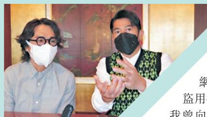
◆城城講起自己也曾是網絡罪案的受害人就激氣。