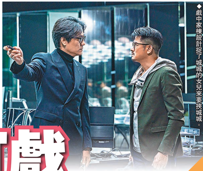
◆戲中家棟設計捉了城城的女兒來要挾城城。