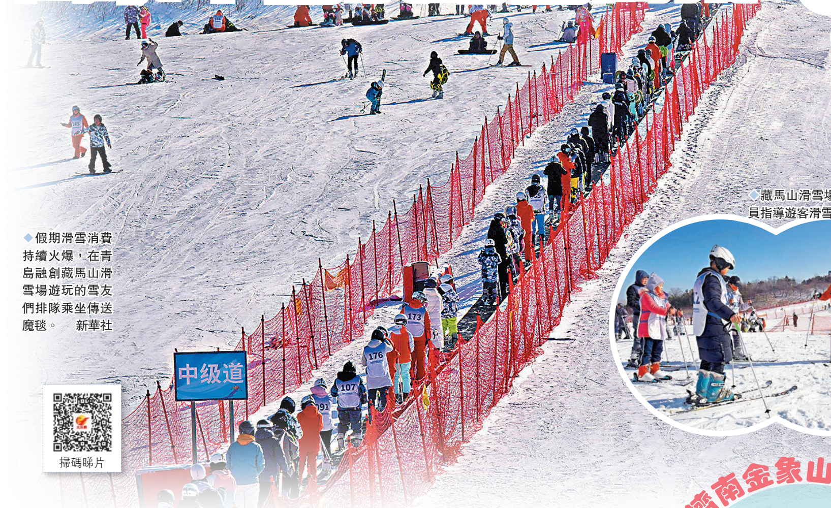
◆假期滑雪消費持續火爆，在青島融創藏馬山滑雪場遊玩的雪友們排隊乘坐傳送魔毯。