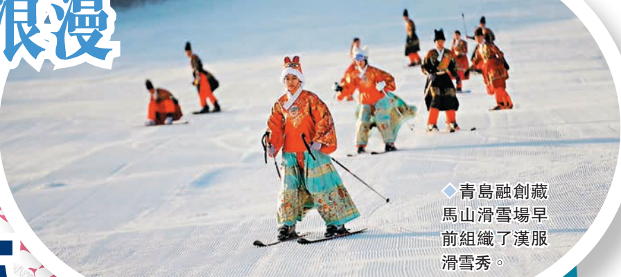
◆青島融創藏馬山滑雪場早前組織了漢服滑雪秀。