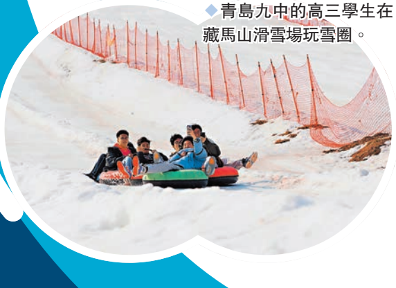
◆青島九中的高三學生在藏馬山滑雪場玩雪圈。

山東的滑雪場一般為人造雪，雪季主要集中在12月至次年3月初。劉聖琳坦言，雖然濟南的雪季僅有兩三個月，但冰雪項目讓傳統景區擺脫了冬季是淡季的窘境。日前，山東省亦向全省16地市發放冰雪消費券，消費券總額突破4,000萬元。