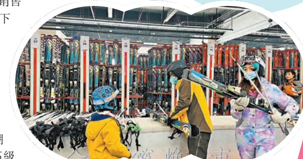
◆藏馬山滑雪場的雪具租賃處設備齊全。

濟南：金象山滑雪場、雪野滑雪場、臥虎山滑雪場、蟠龍山滑雪場 青島：藏馬山滑雪場、金山滑雪場、北宅高山滑雪場、月季山冰雪大世界 煙台：塔山滑雪場、林山滑雪場 濰坊：駝山滑雪場、青雲山滑雪場 威海：恆山滑雪場 泰安：徂徠山滑雪場