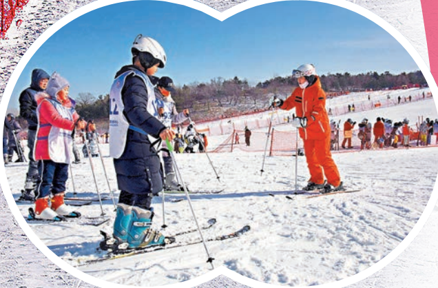
◆藏馬山滑雪場有多名教練員指導遊客滑雪。

「不知天上誰橫笛，吹落瓊花滿世間」——亞熱帶的香港難見冰雪，香港人卻對銀裝素裹的雪情有獨鍾，每逢冬季假期便會飛去日本、歐洲等地賞雪、滑雪。但其實，我們祖國北方許多地方冰雪旅遊資源豐富，當地冰雪產業近年來高速發展，滑雪場基礎設施和配套服務都已達至國際水平，非常值得親身體驗。各大滑雪場有何優勢？附近有什麼風景區？交通路線又該如何規劃？消費成本如何？不妨跟隨香港文匯報記者實地探訪，一睹中國冰雪產業的方興未艾，探索多樣冰雪運動，告訴你神州大地有不少滑雪玩家的「新天地」，聽一下北國風光的冰雪故事。