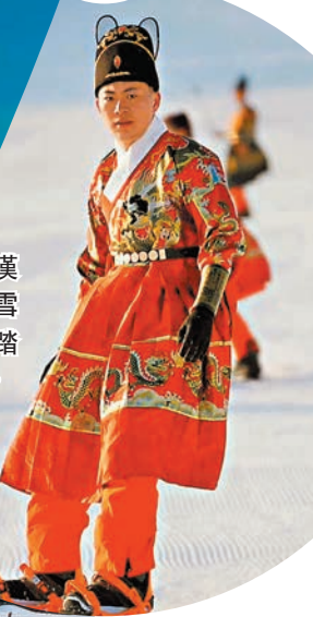
◆一位身穿漢服的姑娘在藏馬山滑雪場體驗滑雪。