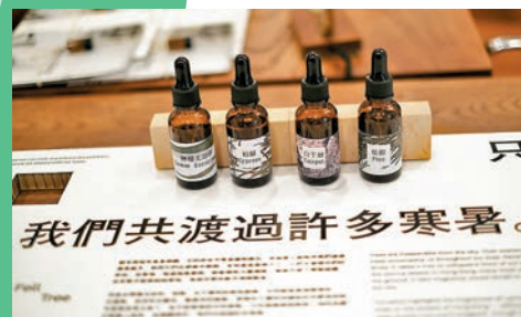
◆《塌樹之味》選取四種香港常見行道樹的精油。