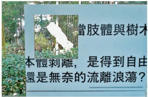
◆當肢體與樹木本體剝離，是得到自由還是無奈的流離浪蕩？