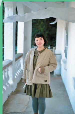
◆《浮遊幻肢》 創作者：蘇嘉慧

本次《一樹無聲》展覽是龍虎山環境教育中心為紀念成立15周年及增強公眾對自然的認識而舉辦的，展覽圍繞真實塌樹事件創作，其中多數為颱風破壞，希望藉此引發人們對生態保護的思考，正如主辦單位對此展覽的描述：「有時，當樹倒下，我們反而看到更多。」