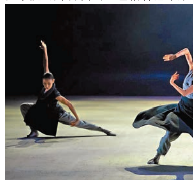
◆香港舞蹈團《山水》劇照

除了演藝節目，香港公共圖書館會在湖北省圖書館舉辦「筆下江湖俠者風——香港武俠小說」專題展覽，介紹香港新派武俠小說的發展，以及梁羽生、金庸、溫瑞安和黃易四位香港武俠小說大師的作品特色和文學成就。署方轄下的非物質文化遺產辦事處則會在湖北美術館播放「賞悅非遺——香港非遺線下展播」，介紹多項香港非遺項目，包括傳統儀式、手工藝和表演藝術等，引領內地觀眾感受香港傳承中華文化而又極具地方特色的都市魅力。