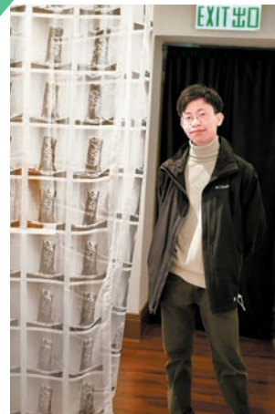
◆《樹木的解剖課》 創作者：朱韋匡