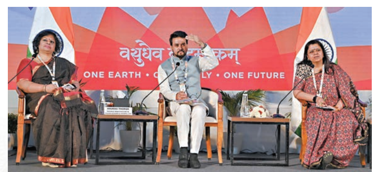
塔庫爾(中)在G20財長和央行行長會議前會見記者。

二十國集團(G20)財長和央行行長會議今日起一連兩天在印度班加羅爾召開，此時正值俄烏衝突滿一年，彭博社前日援引消息人士稱，東道主印度的官員試圖在會議聯合聲明中，避免使用「戰爭」一詞描述俄烏衝突，也不希望G20討論針對俄施加更多制裁。