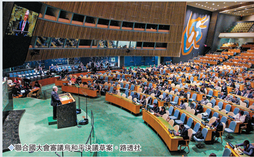
聯合國大會審議烏和平決議草案。