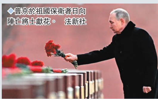
普京於祖國保衛者日向陣亡將士獻花。

俄烏衝突一年之際，俄羅斯總統普京表明，俄國將繼續專注增強核力量，並將開始大規模交付「鈾石」海基高超音速導彈，又首次稱今年將部署能攜帶多枚核彈頭的「薩爾馬特」洲際彈道導彈。