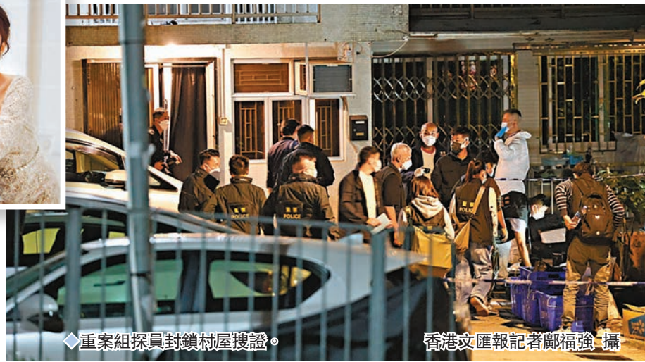
◆重案組探員封鎖村屋搜證。