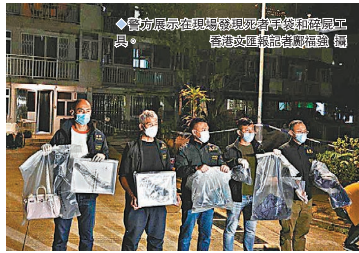
◆警方展示在現場發現死者手袋和碎屍工具。