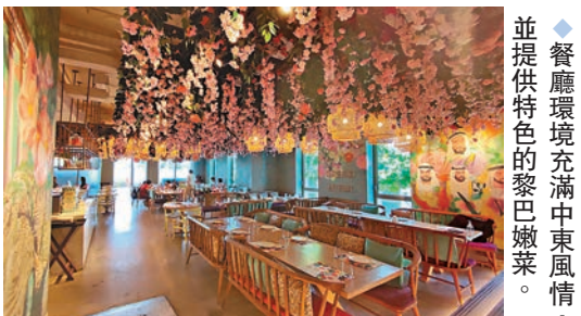
◆餐廳環境充滿中東風情，並提供特色的黎巴嫩菜。