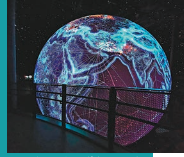
◆這個地球充滿數碼元素