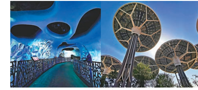
◆Under the Ocean