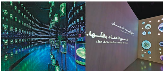
◆第二展區「Heal研究所」，這兒如同美麗的天燈。