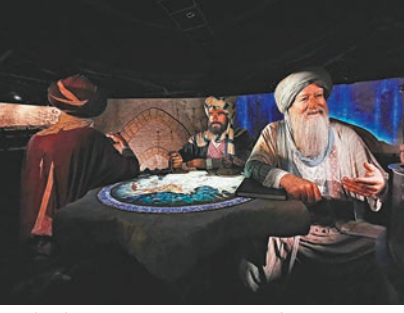
◆館內前段介紹阿拉伯元素