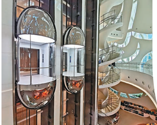
◆館內設有一條蜿蜒曲折的白色樓梯及時空膠囊般的電梯，貫穿了建築的7層樓。