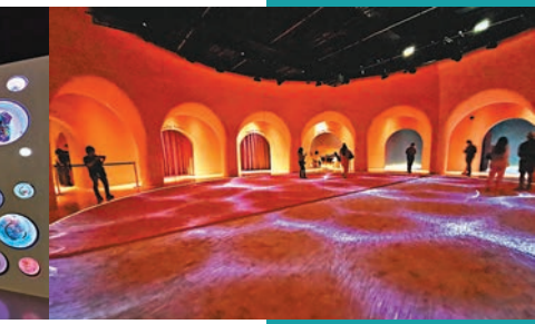
◆第三展區「綠洲」，是一個冥想空間。