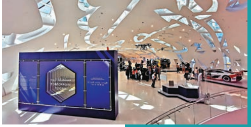
◆離開「Journey to the future」後，便到「Tomorrow Today」展區。