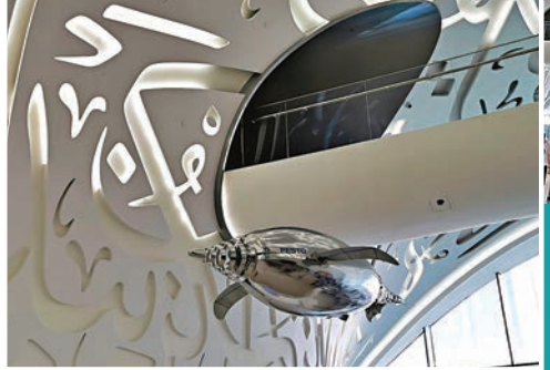
◆筆者在離開博物館前，看到機械豚在表演。