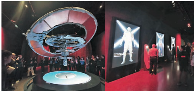
◆第一展區：國際空間站，你可以體驗變身太空人的影像。

最後階段「綠洲」是一個冥想空間，布置得很有阿拉伯特色，你可走到如沙的地方，沉浸在音樂中放鬆身心。至於「Tomorrow Today」一區帶領大家發現新技術將如何改變我們的生活，並展示了人類在最近幾年的熱門研究領域中取得的一系列成就，如自動駕駛汽車和噴氣背包等。同時，海洋生物飄在空中，或無數飛行器在高樓大廈間飛速穿梭。而「Future Heroes」則專為孩童設置，透過互動遊戲和與他人合作，具想像與創造力。