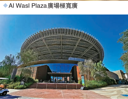
◆Terra可持續發展館外觀