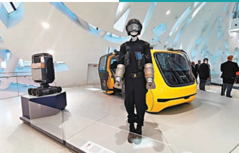
◆你可以在此展區看一系列新技術。