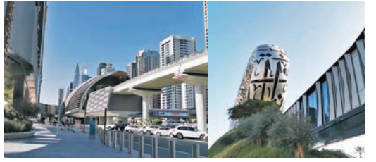
◆博物館鄰近地鐵站，備有天橋直達。