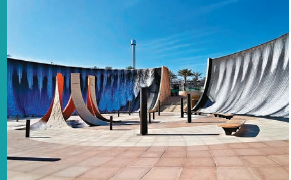
◆Surreal超現實水景，配合音樂演奏，瀑布更美。