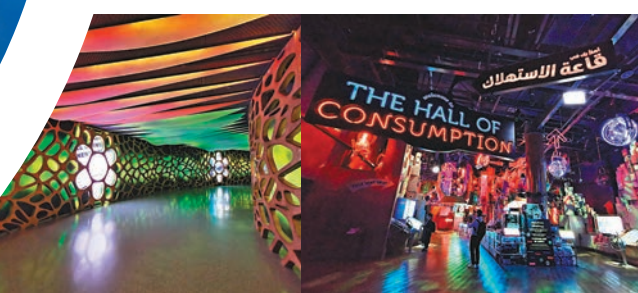
◆館內尾端部分色彩繽紛，可供打卡。