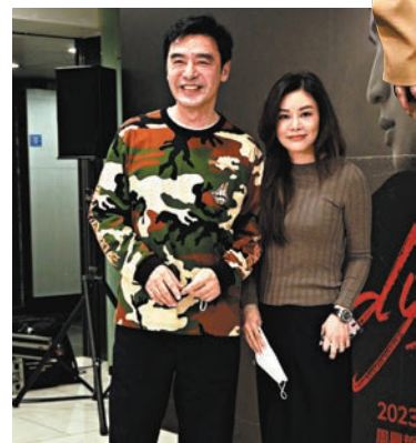
▲鍾鎮濤夫婦捧場Eric紅館演唱會。