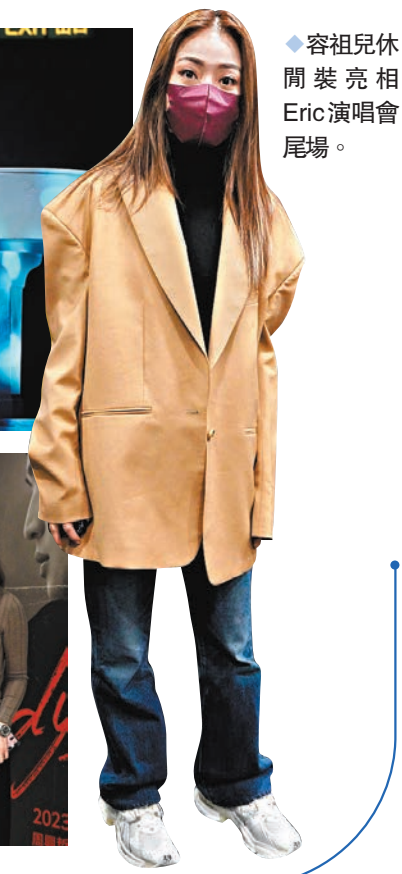
◆容祖兒休閒裝亮相Eric演唱會尾場。