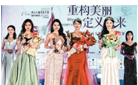
◆「灣區小姐」廣東賽區總決賽爭芳鬥艷，冠軍季軍將獎項新鮮出爐。

灣區小姐環球大賽廣東賽區主席黃鉉在致辭中表示，在目前文娛市場比較艱難的環境下，灣區小姐環球大賽廣東賽區將作為先驅力量，為文化娛樂行業做好榜樣，共同突破困境，創造未來。據悉，世界灣區文化藝術節將致力推廣大灣區文化、旅遊資源、歷史傳統，促進新時代文化交流與文創孵化。