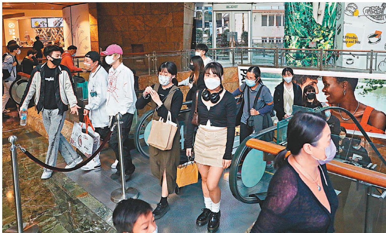
◆口罩令今日起全面取消，香港全面復常，維持959天的口罩令終於解除。盧寵茂期待大家可以展露笑容，講聲『你好，香港！』圖為昨日商場內市民仍戴着口罩。

醫管局昨日宣布，今天起病人、訪客及員工進入醫院仍要繼續戴口罩，臨床醫護人員上班前的快測要求維持。該局會全力配合政府最新復常措施，陸續將過去抽調去抗疫的人手、病床及資源，調回原來崗位，照顧其他病人，令公立醫院服務盡快全面復常。