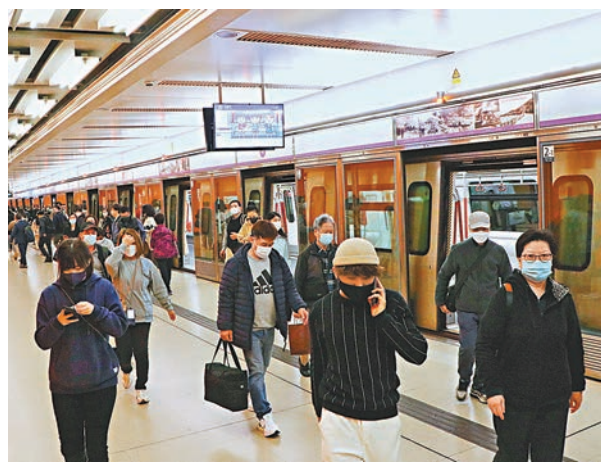
◆多名防疫專家建議幼童、免疫力弱人士及長者等，初期乘坐公共交通工具，或到人多擠迫的地方，及醫院診所等，最好繼續佩戴口罩。

政府專家顧問、港大醫學院內科學系傳染病科主任孔繁毅建議院舍醫護人員、醫院或門診的探病家屬繼續佩