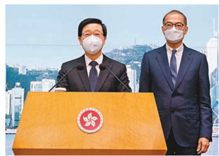
◆李家超昨日於行政會議前會見傳媒宣布全面取消口罩令。右為盧寵茂。

李家超昨日於行政會議前會見傳媒宣布，3月1日起取消僅餘的防疫措施——口罩令。他解釋有關決定基於五項理據：數據顯示香港新冠疫情受控，沒有明顯反彈跡象；香港已經建立廣泛和全面的防疫屏障；人群沒有出現爆發，包括醫院、老人院和學校等；病毒變異沒有大的變壞情況；傳統冬季流感和呼吸道感染的高峰期接近尾聲，整體風險可控。他說：「我認為現在是一個適當時候全面取消口罩令。」