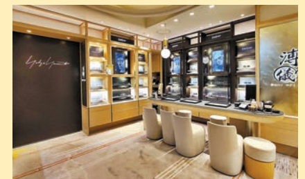
◆指定店舖特換上以啞黑色調為主的視覺陳列，讓大家如置身山本耀司的經典黑色時裝世界。

工藝知識和經驗的日本職人以複雜工序打造而成，展現高貴精巧的質感。整個系列的設計以Yohji Yamamoto標誌性的黑、銀、灰為主調，綴以不同的「Y」字形設計細節，如立體「Y」字形鏡腿及鏡腿末端，於螺絲上的「Y」字形雕刻等，個別款式更加入別具溥儀眼鏡特色的啞金元素，細節處皆展現其精湛工藝。款式備有不同框型，如經典復古圓形、時尚的六邊形和近年備受喜愛的無邊框型，其中「Augment升華」系列更於前框加上鈦合金頂杆設計，營造出成熟優雅又帶點叛逆的氛圍。