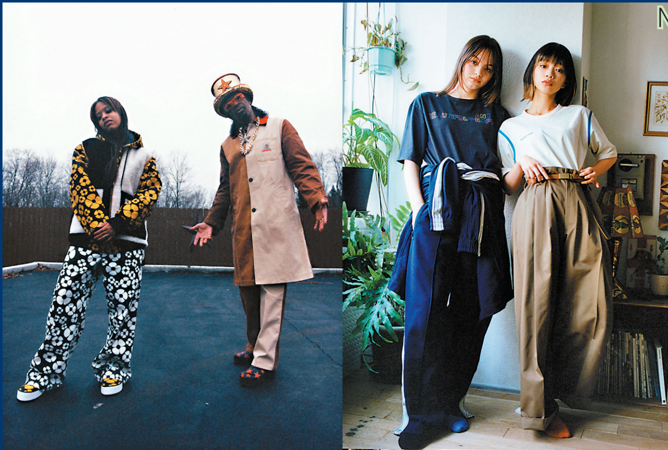
◆MARNI x CARHARTT WIP聯乘系列

如Trench Coat及Riders Jacket。GU希望所有人都能享受這次與「beautiful people」特別推出的聯乘系列，不僅充分展現了兩個品牌的理念，更鼓勵所有性別、身形的人都能以自由的精神享受時尚！