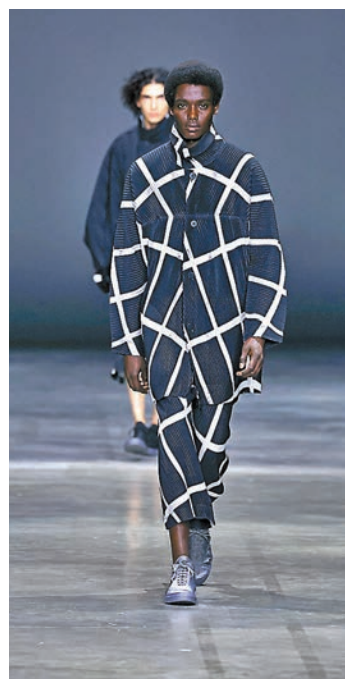
◆秋冬新品男裝保留品牌皺褶元素