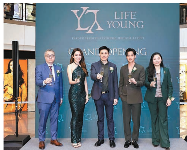
◆海港城旗艦店開幕儀式。

早前，在巴黎男裝周中，模特兒展示了三宅一生品牌最新的2023-2024秋冬新品男裝，從展示中，依然看到品牌的皺褶的設計，並帶有不同色彩，有些更在衣裝中加入形格等設計。