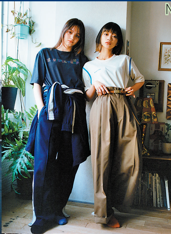
◆「GU and beautiful people」聯乘系列