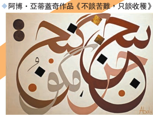
◆阿博·亞蒂蓋奇作品《不談苦難，只談收穫》