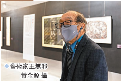
◆藝術家王無邪