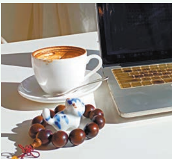
◆小老虎在可憐兮兮地想喝咖啡和虎視眈眈地盯著我寫稿。

滿足了味蕾，也得滿足精神層面。回京前已在朋友圈刷到很多活動海報，各種文化活動、演出、展會及文創市集爆發式湧現。這