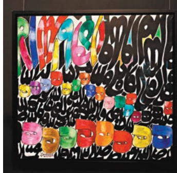
◆查理斯·侯賽因·贊德魯迪作品《無題》

伊朗畫家、書法家兼雕塑家，1937年出生在伊朗首都德黑蘭。他被譽為伊朗現代藝術的先驅，也是最早將阿拉伯書法元素融入自身作品的藝術家之一。贊德魯迪非常擅長運用字母，他的作品以清晰、簡潔和純淨為特點，字母排列亂中有序。