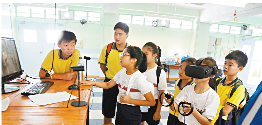
◆教育局邀請全港中小學就資優教育基金11個本學年新辦的校外進階課程，推薦合適的資優生報讀。圖為小學生體驗STEAM活動。