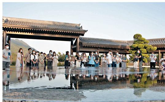
◆40名浸大學生製作《走訪慈山》一書，以說故事表達方式，帶領讀者練習正念、體會慈悲觀和認識自己。

參與的學生分成小組，分別負責整個出書過程的不同環節，包括撰文、編輯、設計與攝影，書本內容涵蓋慈山寺四個主要服務範疇，文章以人物訪談為主，流露佛學對受