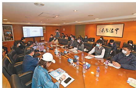
▲創知中學到訪大文集團，師生與編採人員交流。