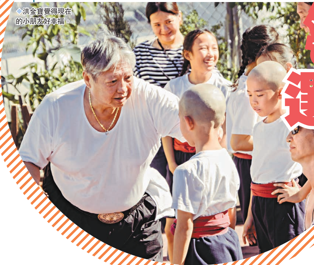
◆洪金寶覺得現在的小朋友好幸福。