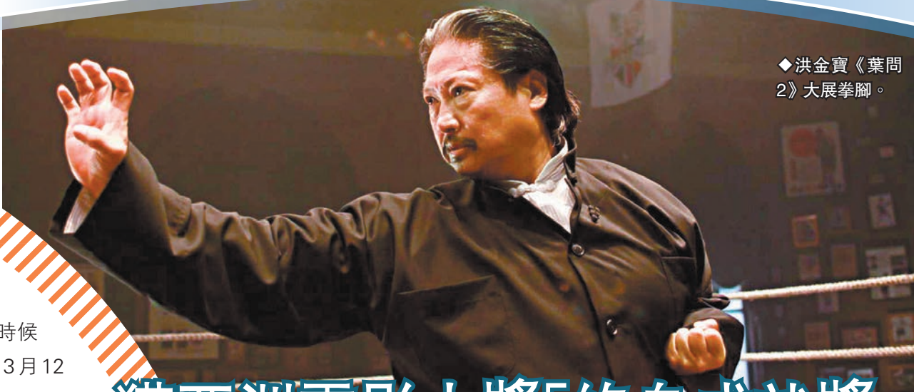
◆洪金寶《葉問2》大展拳腳。

第十六屆亞洲電影大獎「終身成就獎」闊別兩年，今年將此榮譽獎項頒予一代功夫巨星洪金寶，以表彰其為亞洲電影帶來的巨大貢獻及深遠影響。對於獲得此獎項，洪金寶表示：「非常高興！同時亦十分驚喜在這個時候還可以得獎，而且是一個對自己演藝生涯肯定的獎項。」洪金寶將出席3月12日舉行的第十六屆亞洲電影大獎頒獎典禮，接受此榮譽獎項。