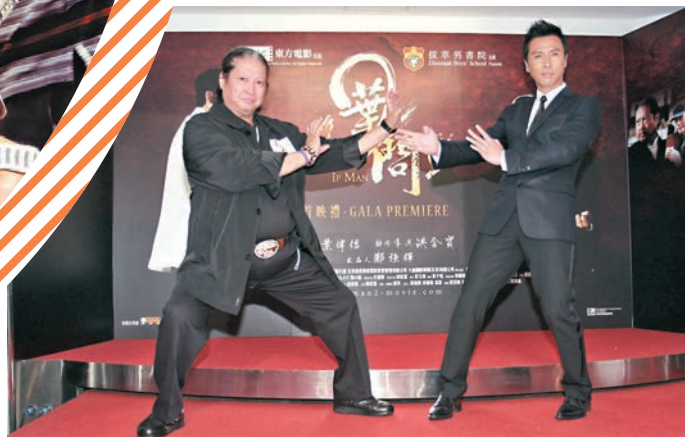
◆洪金寶、甄子丹《葉問2》巔峰對決。