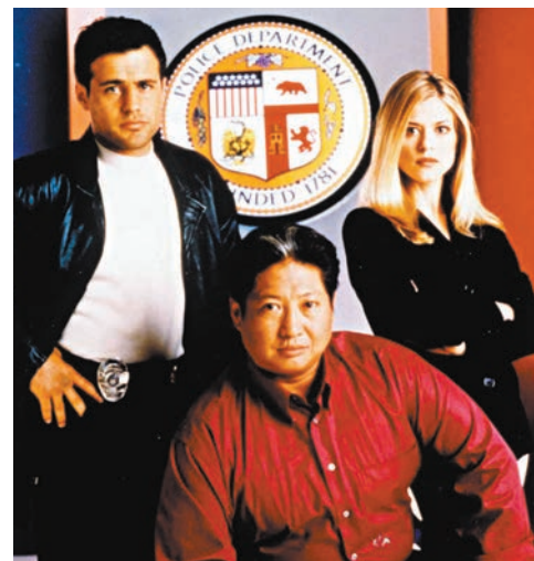
◆洪金寶主演美劇《過江龍》。