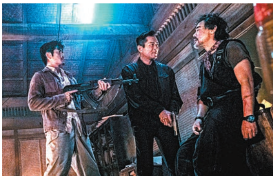
◆三大影帝對戰，氣氛劍拔弩張。