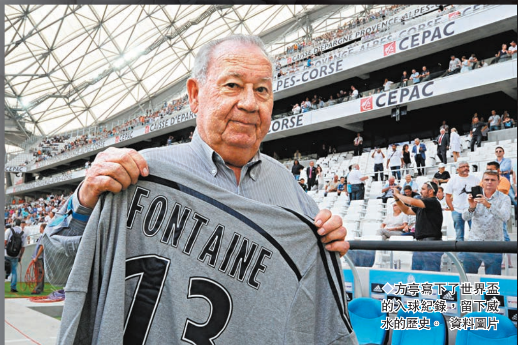
◆方亨寫下了世界盃的入球紀錄，留下威水的歷史。資料圖片