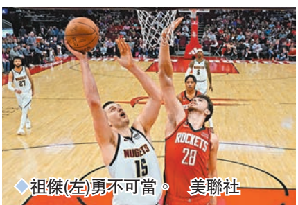
◆祖傑(左)勇不可當。

在明星中鋒祖傑職業生涯第100次「三雙」的率領下，美職籃(NBA)丹佛金塊昨天作客以133:112擊敗火箭，戰績44勝19敗，持續在西岸保持第1。祖傑此役獲14分11籃板10助攻，收下本賽季全聯盟最多的第24次「三雙」，這也是他近20場比賽的第15次「三雙」。