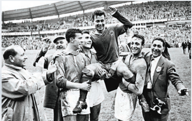
◆方亨(中)在1958年世界盃決賽攻入4球，成為法國隊贏波英雄。

方亨掛靴後開始投入執教生涯，曾於1967年短暫執掌法國教鞭，亦擔任過巴黎聖日耳門及圖盧茲的教練，並於1980年帶領家鄉球隊摩洛哥獲得非洲國家盃季軍。