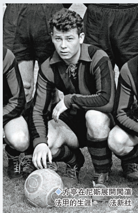
◆方亨在尼斯展開闊濶法甲的生涯。

法甲聯賽冠軍(1955/56、1957/58、 1959/60、1961/62) 法國盃冠軍(1953/54、1957/58) 世界盃神射手(1958) 法甲神射手(1957/58、1959/60) 歐冠盃神射手(1958/59) 金球獎第三名(1958) 國際足協100(2004)