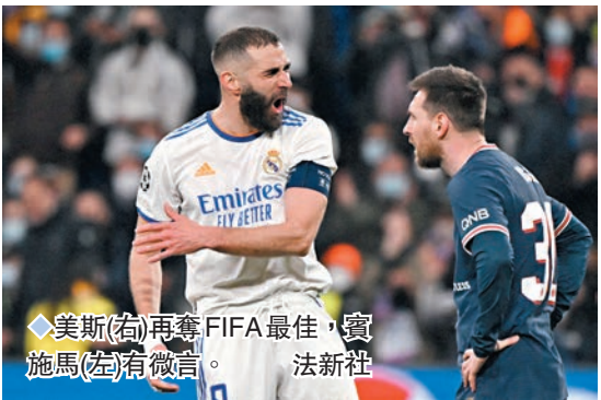
◆美斯(右)再奪FIFA最佳，賓施馬(左)有微言。

獎項結果後在社交網站上載了一段有人說「騙子！對，你就是騙子！」的影片，又分享了一則詳列他上季歐聯冠軍和神射手、西甲冠軍和神射手、63入球21助攻等等的表現數據及所得榮譽的貼文，看來是對失落獎項心有不甘。