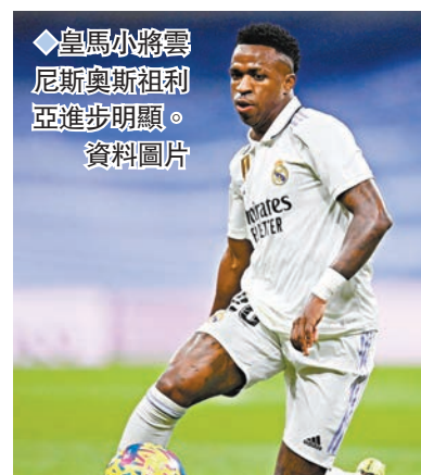
◆皇馬小將雲尼奧斯祖利亞進步明顯。