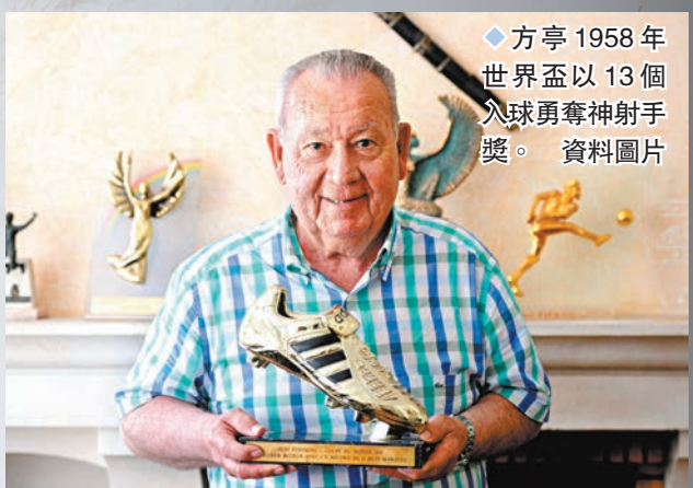
◆方亨1958年世界盃以13個入球勇奪神射手獎。資料圖片