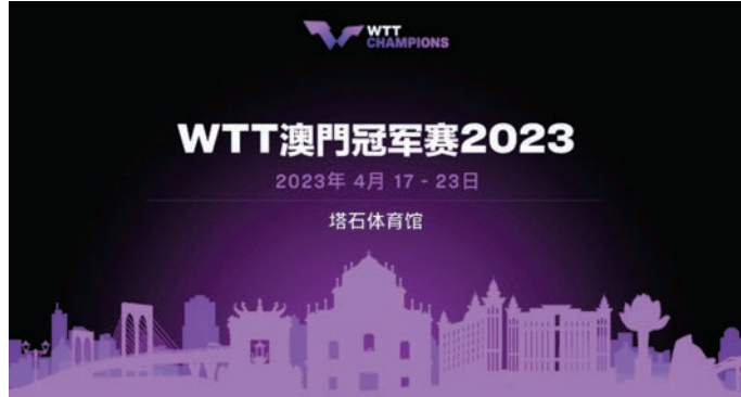
◆WTT澳門賽於4月上演。