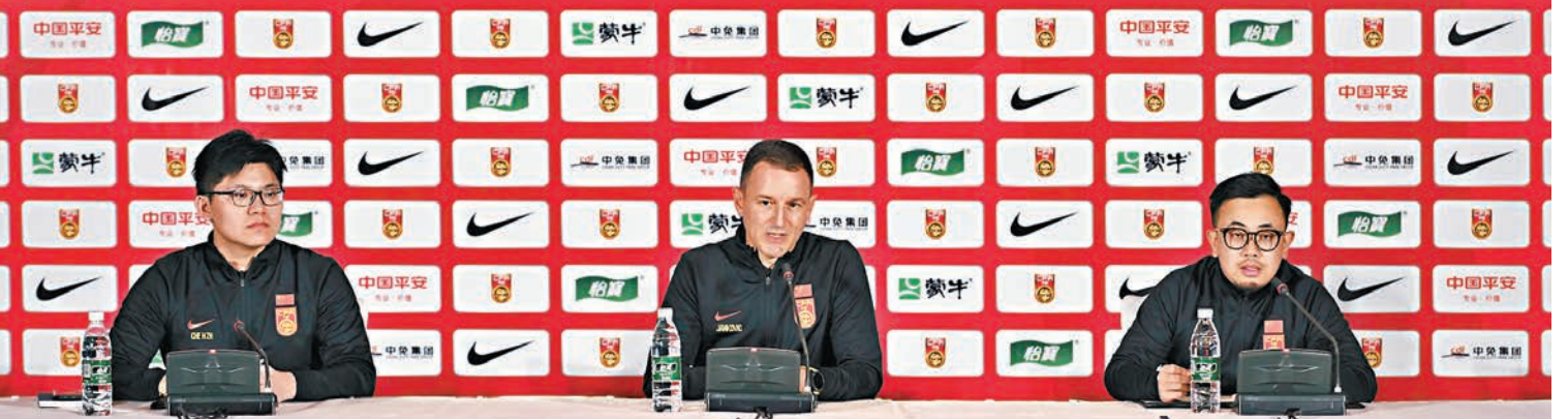
◆揚科維奇(中)在媒體見面會上發言。