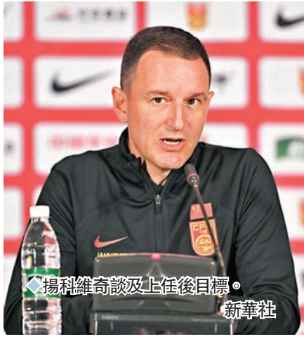
揚科維奇談及上任後目標。新華社

中國足球協會日前表示為備戰2023年亞洲盃、2026年世界盃亞洲區預選賽,決定聘任揚科維奇為國足主教練。1972年5月6日出生於塞爾維亞的揚科維奇在2018年起出任中國U19(1999年年齡段)國家男子足球隊黃隊主教練,對中國足球有一定認識。