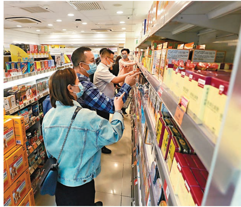
◆香港與內地上月恢復全面通關後，過去幾星期的旅客數字大幅上升。圖為顧客在選購藥物。