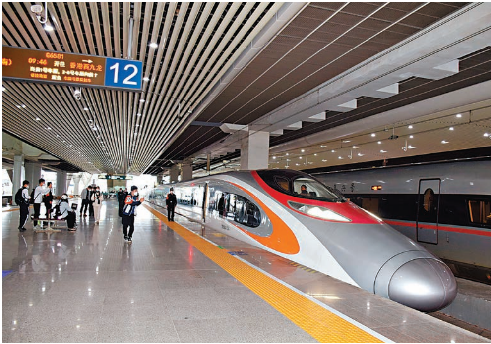
◆有消息指，本月11日起香港高鐵中長途服務將陸續恢復。圖為從廣州南站開往香港西九龍的高鐵「動感號」。