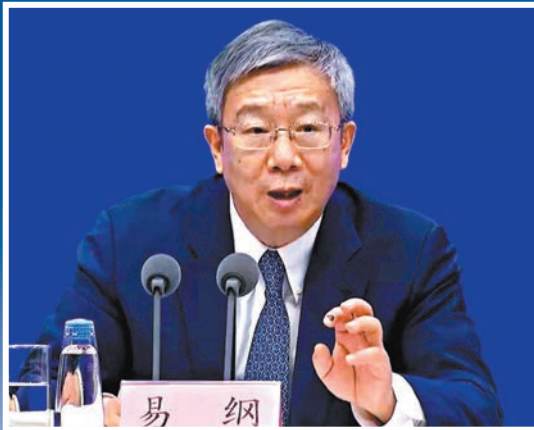
◆易綱表示，目前貨幣政策的一些主要變量處於比較合適的水平，實際利率水平也比較合適。