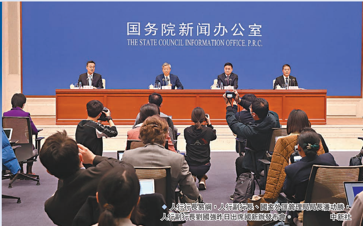
◆人行行長易綱，人行副行長、國家外匯管理局局長潘功勝，人行副行長劉國強昨日出席國新辦發佈會。

人行行長易綱，人行副行長、國家外匯管理局局長潘功勝，人行副行長劉國強昨日出席國新辦發佈會。易綱談及貨幣政策時表示，「貨幣政策在總量上保持對實體經濟的支持力度。2018年以來中國累計14次降低存款準備金率，釋放的長期流動性超過11萬億元（人民幣，下同），總量上充足的信貸增長，對穩就業、保民生起到了至關重要的作用，特別是對於保住小微企業的市場主體，讓他們可以有一個很好的貨幣信貸環境。」