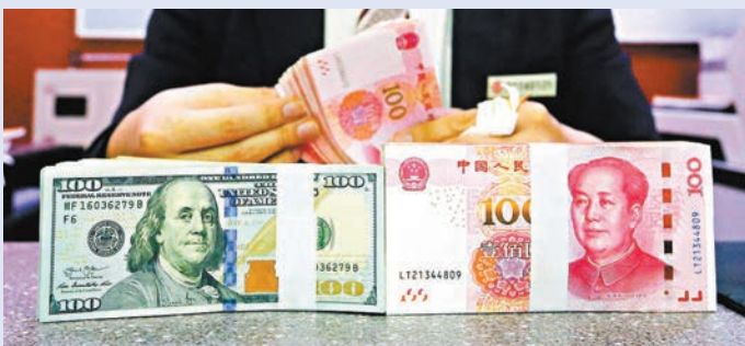
◆未來人民幣匯率還會在合理均衡的水平上基本穩定。

「當前人民幣國際化面臨一些比較好的環境和機遇。」潘功勝稱，下一步，將從聚焦貿易投資便利化、加快金融市場向制度型開放轉變、支持推動離岸人民幣市場的健康發展、提升在開放條件下跨境資金流動的管理能力和風險防控能力四方面，有序推進人民幣國際化。其中，支持推動離岸人民幣市場的健康發展，完善離岸市場人民幣流動性的供給機制，豐富離岸市場人民幣產品體系，促進人民幣在岸離岸市場的良好循環。