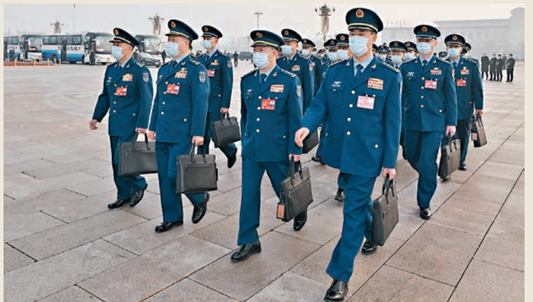
◆3月5日，第十四屆全國人民代表大會第一次會議在北京人民大會堂開幕。這是全國人大代表走向會場。

十四屆全國人大一次會議大會發言人王超4日表示，中國國防費佔國內生產總值的比重多年保持基本穩定，低於世界平均水平，增長幅度也是比較適度、合理的。他強調，中國的軍事現代化，不會對任何國家構成威脅，反而是維護地區穩定與世界和平的積極力量。