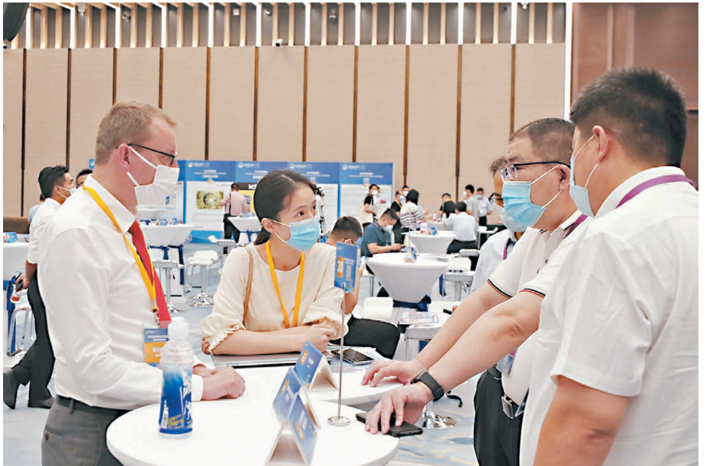
◆國務院總理李克強在政府工作報告中談及今年工作時指出，中國將更大力度吸引和利用外資。圖為第五屆進博會技術裝備展區參展商代表（前左二）在對接會上向採購商介紹企業產品情況。

李克強續指，推動高質量共建「一帶一路」。堅持共商共建共享，遵循市場原則和國際通行規則，實施一批互聯互通和產能合作項目，對沿線國家貨物進出口額年均增長13.4%，各領域交流合作不斷深化。引導對外投資健康有序發展，加強境外風險防控。新簽和升級6個自貿協定，與自貿夥伴貨物進出口額佔比從26%提升至35%左右。堅定維護多邊貿易體制，反對貿易保護主義，穩妥應對經貿摩擦，促進貿易和投資自由化便利化。