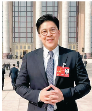
▲霍啟剛在人民大會堂外留影。