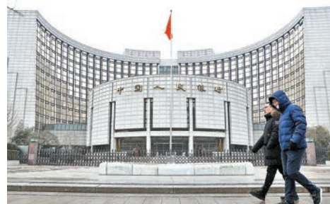
◆隨著人民幣供求趨於平穩，市場料人行一系列逆周期調節措施有條件淡出。資料圖片

2月初，多家國際投行調升年內人民幣匯率預測。滙豐銀行將2023年底人民幣兌美元預測從6.9調整至6.5，但報告也強調人民幣並非處於單向升值路徑。「貨物和服务進口的同步增長可能會令市場參與者在今年晚些時候重新評估中國的國際收支狀況。」渣打銀行預測三季度末及年底人民幣兌美元將分別在6.8和6.75。