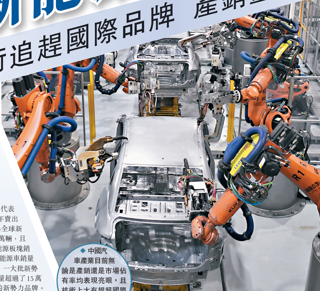
◆中國汽車產業目前無論是產銷還是市場佔有率均表現亮眼，且技術上大有趕超國際品牌之趨勢。 資料圖片