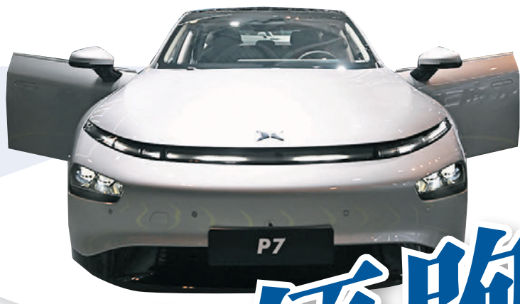
◆小鵬的智能輔助駕駛系統被認為更加符合中國的道路情況。