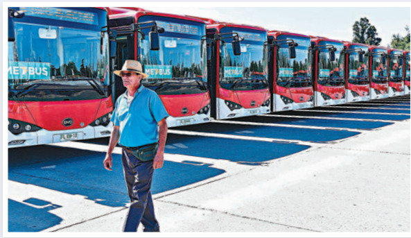
◆比亞迪電動大巴在智利首都聖地亞哥運行。

就因為在技術、智能方面的競爭力，目前亞洲、歐洲市場都成為中國新能源汽車主要新增出口地區。據中國汽車流通協會數據顯示，2022年前三季，近90%中國新能源汽車銷往這兩個地區。另根據全球電動汽車數據庫網站EV-volumes數據顯示，2021年全球新能源車型銷量排名前10車型中，有包括比亞迪秦Plus DM-i、理想ONE、比亞迪漢EV、長安奔奔E-Star等中國品牌車型入榜。