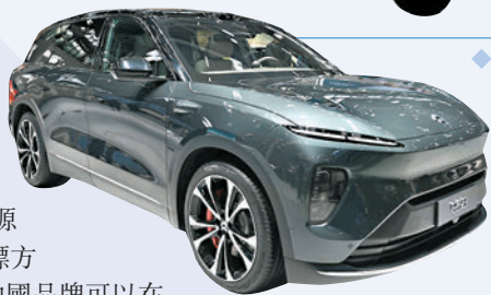
◆蔚來汽車續航里程部分達580公里。