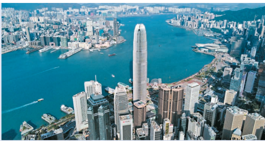
證監會季度報告顯示，去年第四季香港金融市場疫後復甦展現強勁韌性。資料圖片

儘管去年底本港仍受疫情及美國加息等不利因素影響，但金融市場疫後復甦方面已經展現出強勁韌性。據香港證監會昨公布的季度報告，去年第四季，無論在港註冊成立基金的管理資產規模、淨流入本港的資金、獲發牌的資產管理公司數目，以及新股上市活動都按季有反彈。