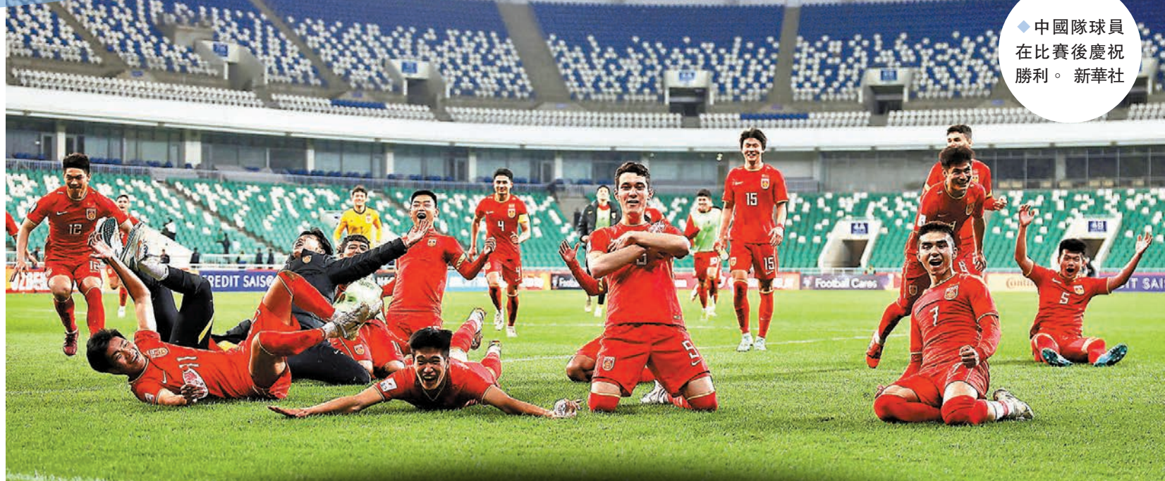
◆中國隊球員在比賽後慶祝勝利。