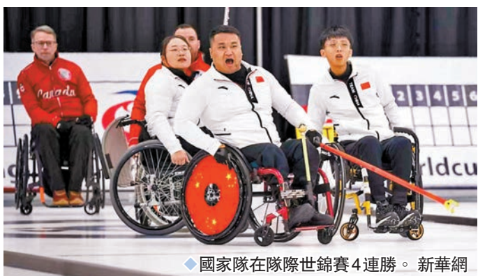
◆國家隊在國際世錦賽4連勝。

混雙世錦賽則是第二次舉行，瑞典隊在2022年拿下首屆賽事冠軍。此次共有19支隊伍參賽，分為兩個小組。兩個小組第1名直接進入準決賽，兩組的第2名與第3名爭奪另外兩個準決賽名額。