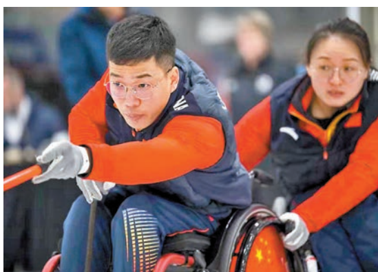
◆國家隊在混雙世錦賽3連勝。