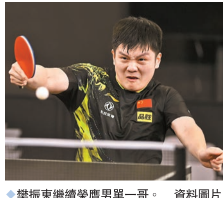
◆樊振東繼續榮膺男單一哥。

另外據新華社報道，世界乒乓球職業大聯盟日前宣布，WTT新鄉冠軍賽將於4月9日至15日在河南新鄉市舉行。WTT董事會主席、國際乒聯第一副主席劉國梁表示，球迷們對去年的WTT世界盃決賽仍然記憶猶新，現在又即將迎來WTT新鄉冠軍賽，乒乓球不僅是球員們拚搏的賽場，更是球迷們的盛會。期待來自全世界的球員在新鄉的賽場上展現最好的自己。