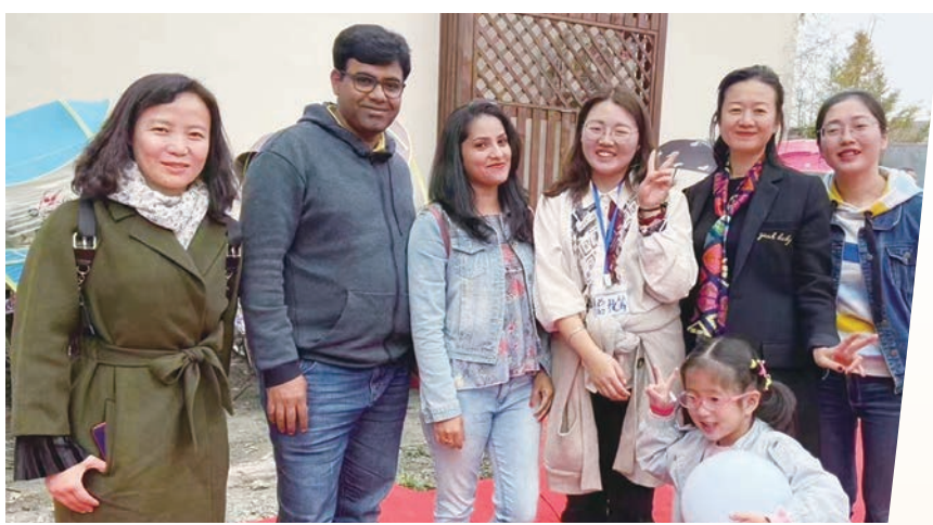
◆ 中外遊客在岷江村遊玩後合影。