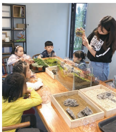
◆ 輔導小朋友製作微盆景。