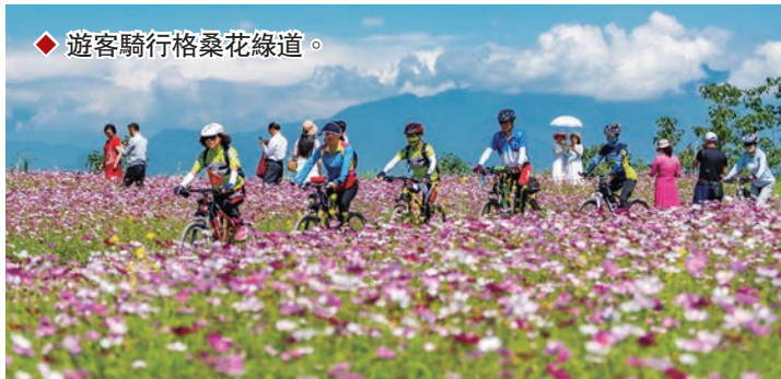
◆ 遊客騎行格桑花綠道。

岷江村十分重視對年輕人的培養，「愛心互助會」對岷江村考上一本、本科的學生分別獎勵1,000元、800元，並通過微信群定期發