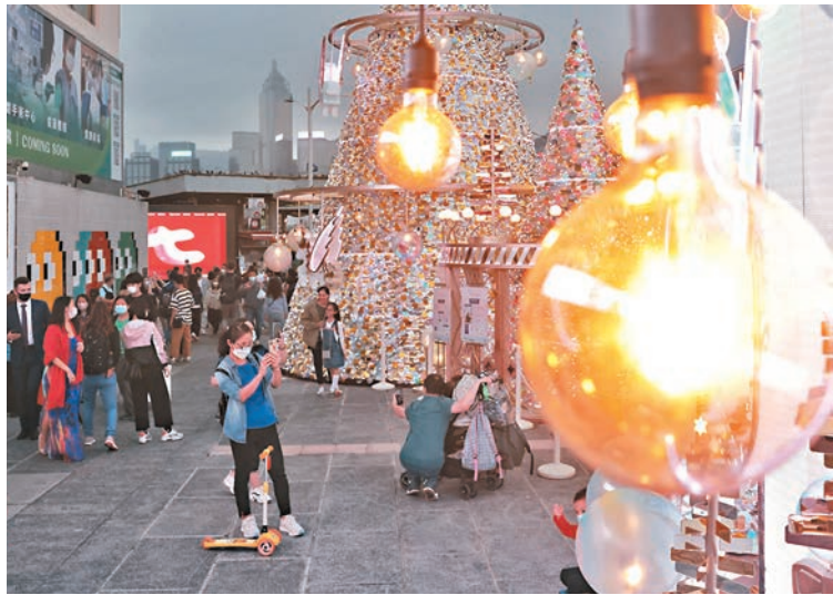
◆中電昨日宣布，下月起向所有客戶提供為期3個月的「燃料費特別回扣」。圖為市民欣賞燈飾。 資料圖片

工聯會立法會議員郭偉強對香港文匯報表示，中電只將燃料調整費「封頂」3個月並不足夠，認為目前最大問題是燃料價格的波動全數轉嫁予用戶，電力公司在管