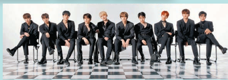
▲ Golden Child成員Y要入伍。

至於《氣象廳的人們：社內戀愛殘酷史篇》、《無法抗拒的他》大勢演員宋江，雖然未有確實的入伍日期，可是早前原本說2月開始要出國舉行的粉絲見面會巡演