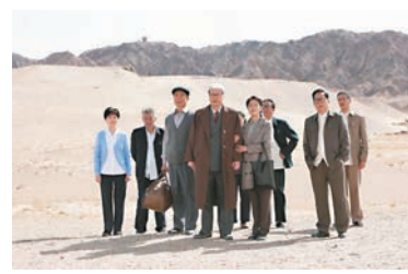
◆《敦煌女兒》以舞台劇為藍本。