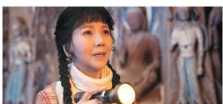
◆《敦煌女兒》未上映已榮獲多個獎項。

的敦煌人，用一代又一代的堅守保護瑰麗的敦煌莫高窟文明，並結合數字時代開發「數字敦煌」，讓敦煌文化得以在世界舞台上傳播。在電影海報中，茅善玉扮演的樊錦詩頭髮花白，背影依舊堅毅，她用手電照亮的是敦煌莫高窟第259窟中的禪定佛。一同釋出的群像海報中，樊錦詩、常書鴻、段文傑等為敦煌文化奉獻一生的前輩背靠大漠，或眼神堅定凝視鏡頭，或目光灼灼望向遠方，心懷期許的展望中，一段有關敦煌文化守護的故事，正在大漠戈壁中緩緩流淌。