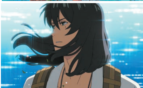
導演：新海誠 聲演：原菜乃華、松村北斗、深津繪里、染谷將太、神木隆之介、松本白鸚