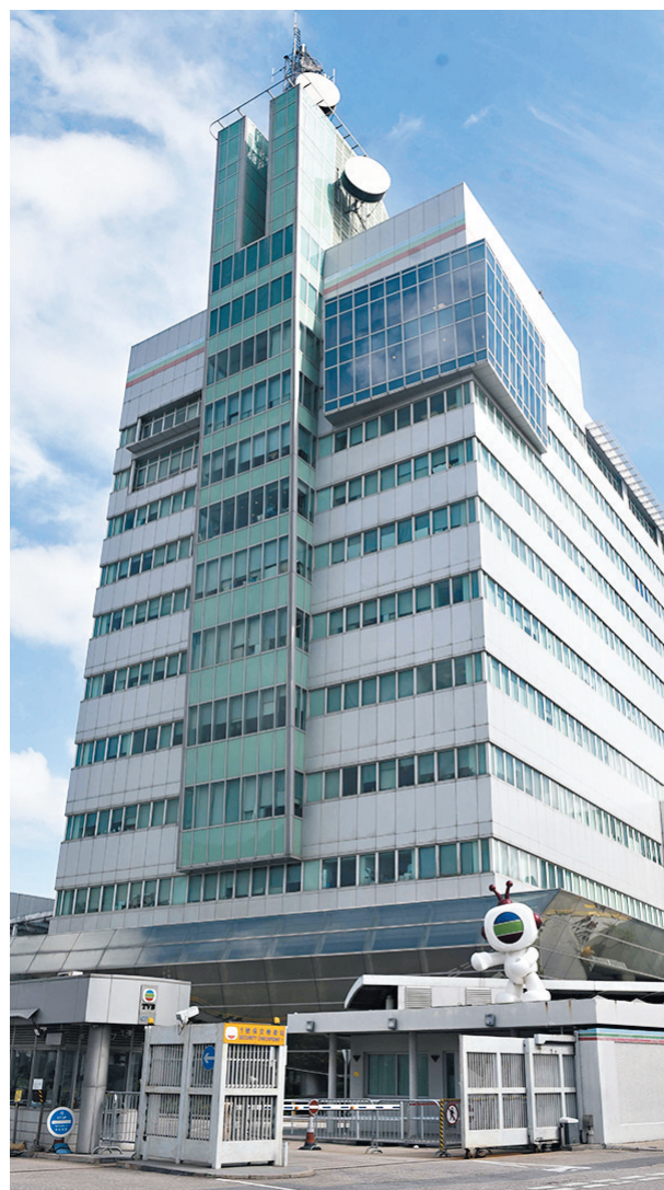
◆TVB早前舉行的一場帶貨直播,為集團帶來約2,650萬港元總銷售額,累計觀看人數逾320萬。

港股方面,恒指繼續反覆下挫失守2萬點大關,全日跌125點,收報19,925點,成交1,030億元。獨立股評人彭偉新表示,市場預期美國就業數據將趨緩和,但若最後公布數字仍高於市場預期,投資者對往後進一步提升加息幅度的困擾將更加巨大,對大市的影響也會更明顯,故現時投資者都傾向沽貨離場避險。