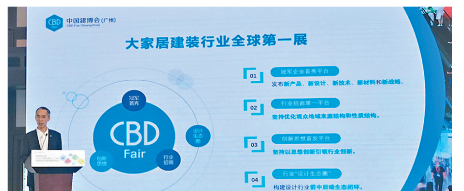
◆主辦方介紹中國建博會(廣州)籌辦情況。

香港文匯報訊(記者 章蘿蘭 上海報道)2月CPI同比增速低於預期,表明需求仍然偏弱,昨日A股大盤震盪整理,滬深指數微幅下探。美國物理學家聲稱找到了一種新材料,實現常溫超導,A股超導概念股亦掀起狂歡。截至收市,上證綜指報3,276點,跌7點或0.22%;深圳成指報11,579點,跌18點或0.16%;創業板指報2,372點,跌4點或0.21%。兩市共成交7,566億元(人民幣,下同),北向資金淨賣出41.76億元,為連續3個交易日淨賣出。