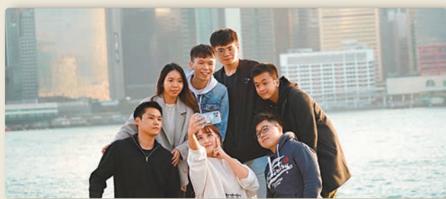
▲此照片攝於特區政府公布「青年發展藍圖」之際，香港年輕人充滿活力。